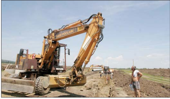
Az épülő ipari park.