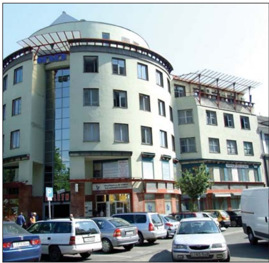
A Bató-üzletház déli homlokzatának kialakítása.

Építészeti szempontból az üzletház északi bejárata a székház árkádjai alatt kapcsolódik a főutcahoz. A mostani fényképfelvételeken a Széchenyi utcai homlokzat földszinti közepső traktusa fölött olvasható az „üzletház” felirat, egyben biztosított a belső terek megközelítése. A déli homlokzatalakításhoz pedig jól illeszkedik a földszint plusz két emeletes Metropól hátsó ki-, illetve bejárata. Mivel a Metropól fél évtizeddel később építették és adták át, tervezésénél meghatározóan vették figyelembe a Bató-üzletház déli, délnyugati homlokzatának kialakítását.