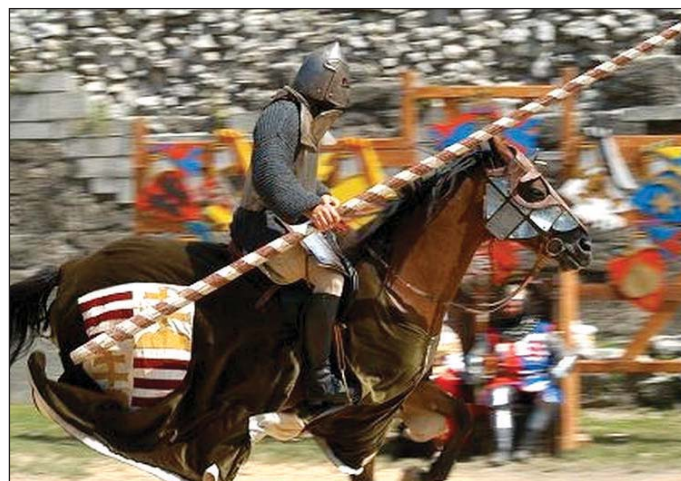
Középkori hangulat a várban.

Augusztus 9-én és 10-én újra elvegyülhetünk Nagy Lajos király Középkori Forgatagában. A diósgyőri vár legnagyobb turisztikai