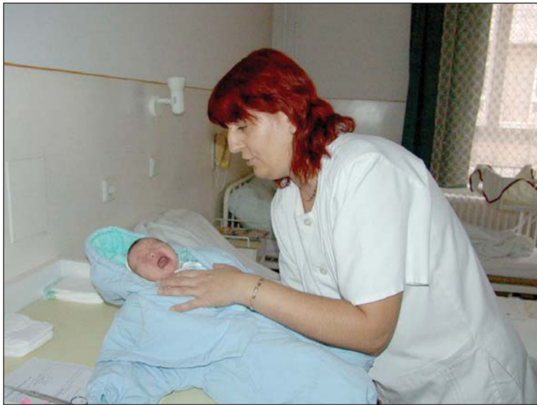
A Semmelweis Kórház szülészeti osztálya egymillió forintból korszerűsödhet és újulhat meg.

A gyermekirás tehát augusztus negyedikétől már a Diósgyőri Kórház volt traumatológiájának kórtermeit tölti majd be. Ide költözik a szülészeti osztály négy emeleten működik majd tovább. Az épületben jelenleg is folynak a felújítási munkák, amelyekre azért van szükség, hogy az eredetileg nem ilyen célra kialakított helyiségek fogadni tudják a babákat és a kismamákat. Addig azonban még hátra van a költözés, amelynek ideje alatt sem itt, sem pedig a Semmelweis szüle-