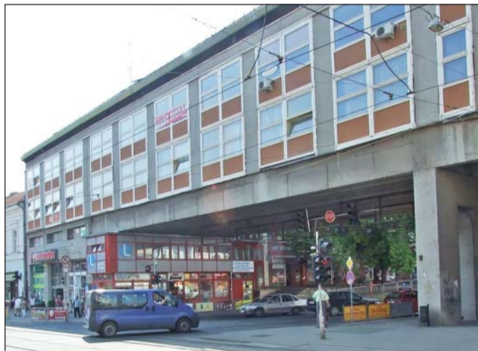
A Bató-ház ma.