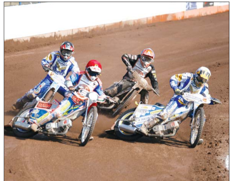
A nehezebb ágon kell bizonyítaniuk a magyar vaspapucsosoknak.

Kijelölte a lengyelországi Lesnóban zajló Salakmotor Csapat Világbajnokságra utazó magyar válogatott névsorát a csapatvezetés. A miskolci kvalifikációs viadal megnyerése után a világ legjobb nemzeti csapatai ellen küzd majd szombaton este 7 órától a magyar válogatott. A bravúrra készülő legjobbjaink 5 fős csapatából hárman a Speedway Miskolc versenyzői. Válogatottunk pénteken reggel indul a csapat vb helyszínére.