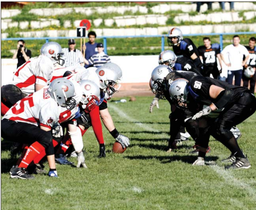
Szemtől szemben: Miskolc Steelers–Dunaújváros Gorillaz.

Kezdjük a visszatekintést mégis a jóval. Második bajnoki évadának vágott neki a három éve létező egyesület az év eleji intenzív felkészüléssel, majd áprilistól a hivatalos mérkőzésekkel. A közel félszáz főre rúgó keret zöme rutinosabb lett, néhány posztra újak érkeztek és quarterback pozícióban egy behozhatatlan képzettségű előnyben lévő amerikai „idegenlégióssal” erősödött a támadó szekció. Az offense ennek köszönhetően egyes meccseken kiemelkedően jól teljesített, máskor a defense-nek kellett erőn felül küzdenie az egy pontért; összesen háromszor az idény során azonban ez is kevés volt. Jó mérleggel és az előzetes várakozásoknak megfelelő helyezéssel jutott túl a hat bajnoki fordulón a Steelers, beleértve a bravúrral kiharcolt rájátszás elődöntőjét is: a Divízió II. Keleti csoportjának második helyéhez,