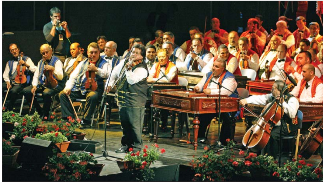
A 100 Tagú Cigányzenekar tíz év óta először lépett fel városunkban.

A világon egyedülálló 100 Tagú Cigányzenekar koncertezett a hétvégén Miskolcon. A csoport a Jégcsarnokban lépett közönség elé. Az érdeklődés azonban elmaradt a várttól – a szervezők veszteséggel zártak.