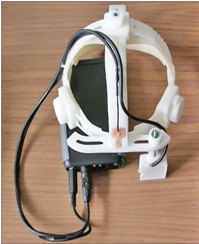
Az audiovizuális transzkóder eszköz felülnézeti képe.

prototípusát (audiovizuális transzkóder eszköz), mely jelenleg klinikai kipróbálás alatt áll. Az egy-