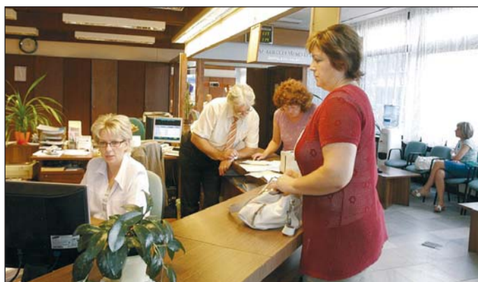
A közös ügyfélszolgálati iroda a Szemere utca 5. szám alatt.

Több kiállítást láthat a közönség Miskolcon. A Miskolci Galériában a Grafikai Triennálé anyagát, a Színháztörténeti és Színházművészeti múzeumban az állandó tárlat anyagát és Dávid Attila díszlettervező művész időszakos kiállítását. A Művészetek Házában Czidor Ágnes festőművész mutatkozik be, a Herman Ottó Múzeum központi épületében a képtárat és Bálint Endre szentendrei festőművész munkáit tekinthetik meg az érdeklődők. A Papszeren lévő műemléképületben pedig a Levendel-gyűjtemény látogatható, valamint a Képhasítás világa és a Víz előtti régészet című tárlatok. A Petőfi Irodalmi Múzeum Nyugat 100 Busz címmel egy mozgóképi kiállítást hoz a Múzeumok Éjszakáján Miskolcra.