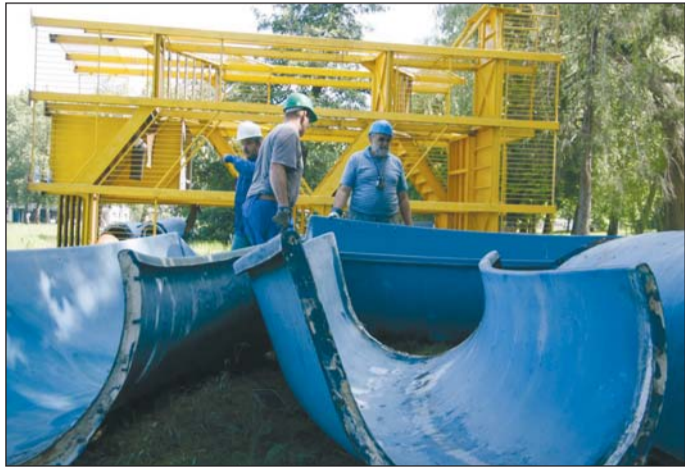
A csúszda már a földön, szétszerelve.