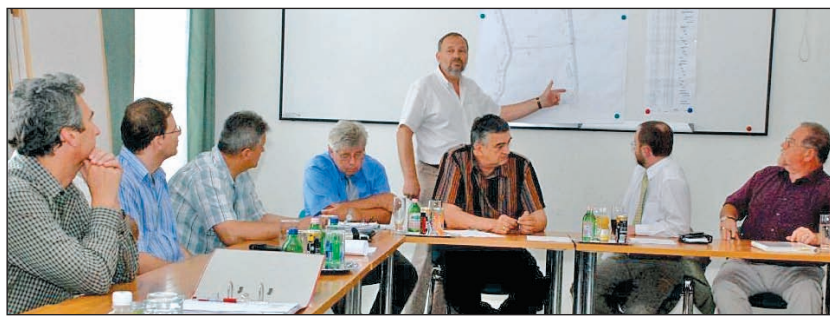
Indul a kivitelezés – mondták a fórumon.

Újabb fontos állomáshoz érkezett a miskolci sportrepülőter mellett épülő Mechatronikai Ipari Park megvalósítása. Kedden Ipari Park Fórumra hívták a munkálatok által érintett vállalkozásokat.