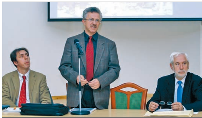
A stratégiát lakossági fórumokon is megvitatják.

Miskolc város művészeti és tudományos ösztöndíjainak adományozása is téma lesz a közgyűlésen, melyhez 2008-ban négy millió forint áll rendelkezésre. A szeptemberi kiírásban ötven juthatnak Alkotói Ösztöndíjhoz, ketten egyszeri alkotóihoz, ötven Pályakezdő Ösztöndíjhoz és négyen az Útravaló Európa Ösztöndíjhoz.