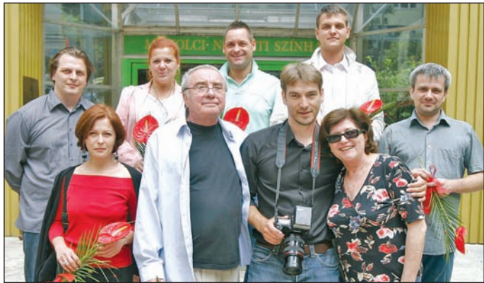
A társulat díjazottjai.