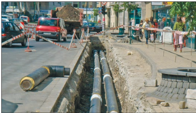
Június közepére fejezik be a munkát a Szentpáli utcán.

Így most is arra törekcsenek majd, hogy a meghirdetett időpont előtt elvégezzék a munkálatokat, és mihamarabb visszakapcsolják a szolgáltatást. A nyári nagy karbantartás alatt javítják ki azokat a hibákat, melyeket a fűtési idényben végzett hálózatellenőrzések tárnak fel. A mostani leállás alatt a legnagyobb volumenű munkavégzés a 3-as út Dankó Pista és Bihari utcák kereszteződésében lesz. A főút alatti vezetékben már több hónappal ezelőtt bizonyították a mérések, hogy korróziós lyukadás van. A fűtési idényben azonban nem állították le emiatt a szolgáltatást, mivel a folyama-