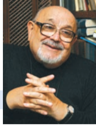
dr. Popper Péter, pszichológus, író.

A Nemzetközi Kereskedelmi Központban (ITC) rendezvénysorozat indul, melynek házigazdája