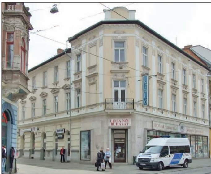
A volt szálloda az emeleti felújítás után.

A tözsde persze megbukott, de a kávéház maradt mindaddig, amíg az épületet át nem alakították. Czeizler Adolf kávé adta a Lloyd-kávéház nevet, az emelet pedig szálloda volt, hiszen a kereskedők a tözsdézés után itt töltötték éjszakáikat. 1906-ban aztán megnyílt a mai kétemeletes új épület. A földszinten kávéház, szálloda étterem és üzletek voltak, az emeleti traktusokban különböző felszereltségű szállodai szobák. Az 1930-as évek szállodai rangsorában ez volt a negyedik. 85 szobája volt a Koronának (későbbi Avas