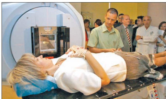
Az egyik legkorszerűbb onkológiai centrum jött létre.