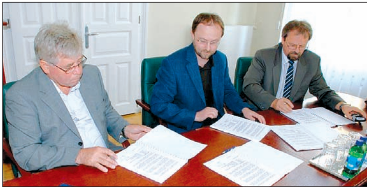
A napokban írták alá a szerződést a kivitelező céggel.

Mint ismeretes, a Miskolci Ipari Park bővítését megvalósító, mintegy 1,5 milliárd forint összértékű fejlesztés, az úgynevezett Mechat-