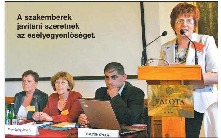
A szakemberek javítani szeretnék az esélyegyenlőséget.

„Hátrány – kompenzáció – esélyteremtés” címmel országos szakmai konferenciát szerveztek Lillafüreden.