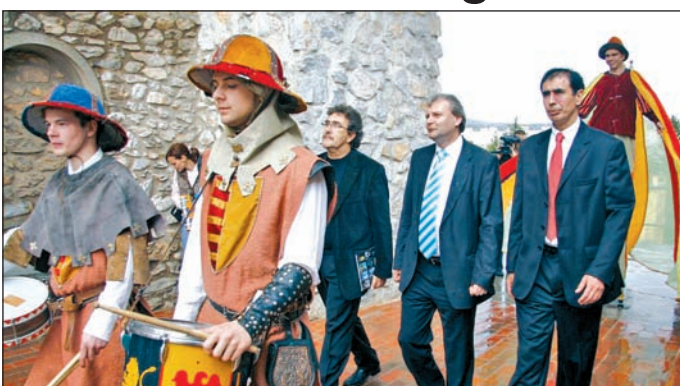
Miskolcon járt Hiller István, oktatási és kulturális miniszter pénteken. Előbb a diósgyőri várban nyitotta meg a Reneszánsz évét, majd részt vett a Lézerpont Látványtár felavatásán, és megismerkedett az Egyetemi Fűtőmű projekttel is.