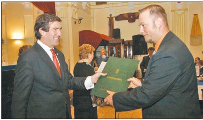
A rendezvény végén hatvanegyen vehettek át mesteroklevelet.

Mint mondta, a kamara továbbra sem látja azokat a „motorokat” – kapacitásokat, fejlesztéseket – amelyek a gazdaság növekedését beindíthatják. Az előrejelzések fényében mind fenyegetőbbé válik annak a veszélye, hogy a magyar gazdaság stagnálásközeli pályára kerül, és a növekedés jövőre sem indul meg. Az MKIK elnöke úgy vélte, bebizo-