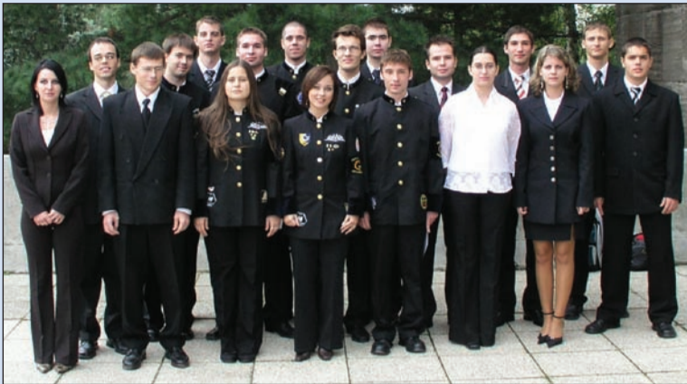
Köztársasági ösztöndíjasok 2007 szeptemberében

mérnök informatikus, programtervező informatikus, gazdaságinformatikus.