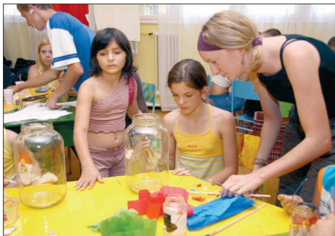
Különálló otthonokba költöznek a Gyermekváros lakói.