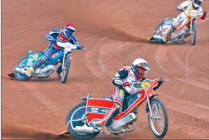
Októberben BEK-et nyert a Miskolc Speedway.

ÁPRILIS 15–22.: U18 divízió II/A, jégkorong-világ bajnokság. Tavaly elbúcsúzott, az idén szeretett volna visszajutni a magyar együttes a korosztály második vonalába. A miskolci csoportban öt másik gárda (Belgium, Észtország, Hollandia, Izrael és Mexikó) társaságában korszakoztak jégre a mieink. Eduard Giblak szövetségi kapitány nem bizonyult rossz jónak: a magyar és a holland együttes négy-négy győzelmet aratott zsinórban, ezért aztán egyszerű volt a képlet. Amelyik nyer az utolsó fordulóban, az kerül fel. A záró húsz perc elején támadt fel a magyar csapat, két perc alatt két gólt szerzett, elérhető közelségbe került az egyenlítés. Másodpercekkel a befejezés előtt Kóger lőtt, a pakk becsúszott a kapuba, de kiderült, hogy ez már időn túl történt. A hol-