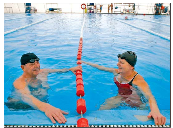
Január 1-jétől csak az első medence működik a Selyemréten.

Üresen áll a selyemréti strand melegvizes medencéje. Bár az egykori döngyözőből még jön a víz, használni már senki sem fogja a „piskótát”. Sokan csak így nevezik a jó pár évtizeddel ezelőtt épített, meszelt falú medencét, amely ma már teljesen elavultnak számít. Ebben a medencében már nem lesz víz, a döngyöző csak azért működik, mert a szakértők attól tartanak, hogy ha elzárják a kutat, az beáll, az újraindítás pedig költséges lenne. Hozzáteszik: ekkora medencét egyben tartani, és azt vízforgatóval ellátni nem lenne érdemes. Ekkora felületen ugyanis nagy hővesztések keletkeznek, ezért a medence vízének melegen tartásához rengeteg pótvízre lenne szükség. A szakemberek azt mondják, hogy mindemellett a jelenlegi repedezett falú medencét alapnak sem szabad megtartani, pont az állapota és a korszerűtlensége miatt. A „piskótában” tehát többé senki nem úszik