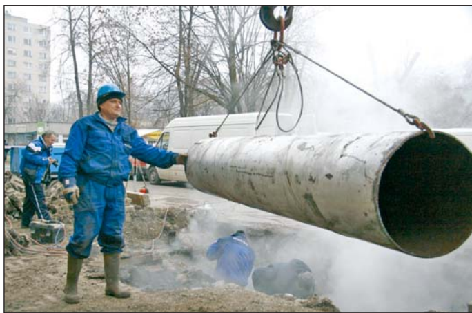
Egy gerincvezeték tört el december 26-án.

A csőtörés miatt kialakult szolgáltatás-kiesés a Vörösmarty lakótelep – Jókai lakótelep – Győri kapu lakótelep – Vologda lakótelep – Újgyőri főtér, valamint a Szentpéteri kapu távfűtési szolgáltatással ellátott lakásait érintette. Volt, ahol már délutánra sikerült a szakembereknek helyreállítani a szolgáltatást, de késő estére már mindenhol meleg volt a radiátorok. December 29-én aztán a Vologda városrészben volt egy