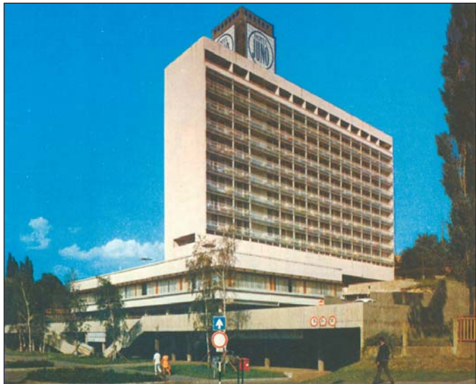
Hotel Juno, Miskolc-Tapolca, 1974.

keveset beszélgethettünk, mert aktív időszakomban már elköltözött Miskolcra. Most, hogy könyvét forgatom, fölsejlik bennem, hátha nem is egészen ez az ő könyve.