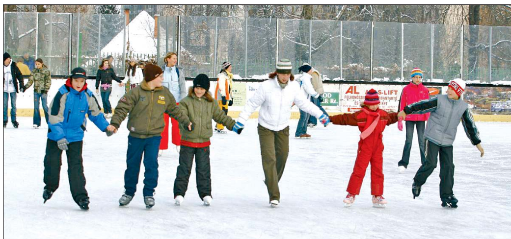
Néha be sem férnek a korcsolya szerelmesei.

A Jégcsarnokba 500-520-an férnek be, a közönségkorcsolyázók és a jégdiszko alatt mindig telt ház van. Sőt, sokszor több tucatnyian kint is ragadnak, hiszen a baleset- és tűzvédelmi szabályok miatt nem engedhetik be őket.