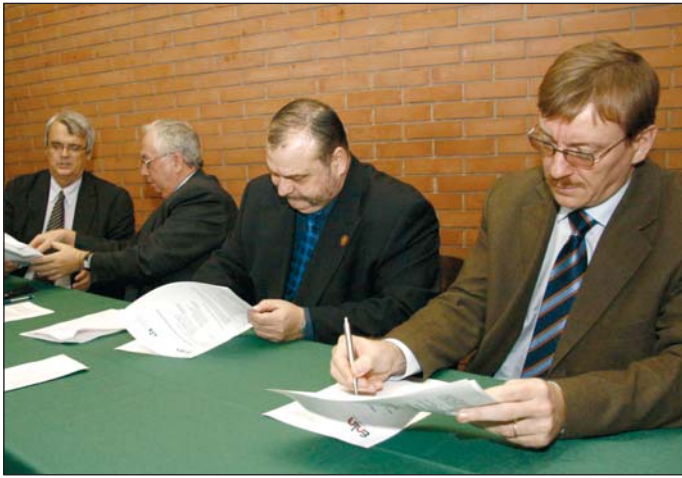
A fórumon a tagok együttműködési megállapodást is aláírtak.

A világ gazdaságában ma már a klaszteresedés az egyik legfőbb tendencia, Európa ugyanis csak így