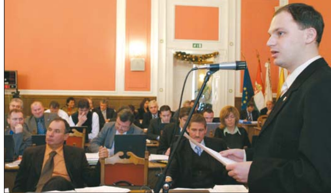
A grémium a közüzemi díjak emeléséről is döntött, melyek mértékét az ellenzéki képviselők nem támogatták.