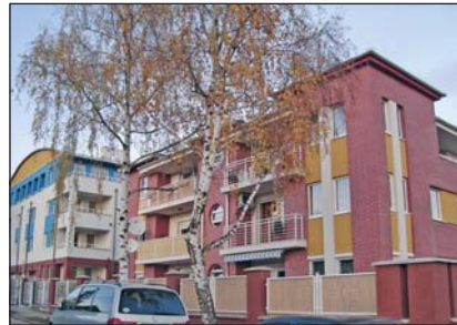
Győri kapu 2006–2007

Elkészült a Végvár beruházásában a Nyírfa Lakópark második üteme is. A lakóparkban összesen 24 lakás átadásra került sor. A jelenleg elkészült II. ütem egy 14 lakásos társasház, liftes, akadálymentesített épület a földszinten garázsokkal és tárolókkal. Az átadásra egy eladatlak lakás ma-