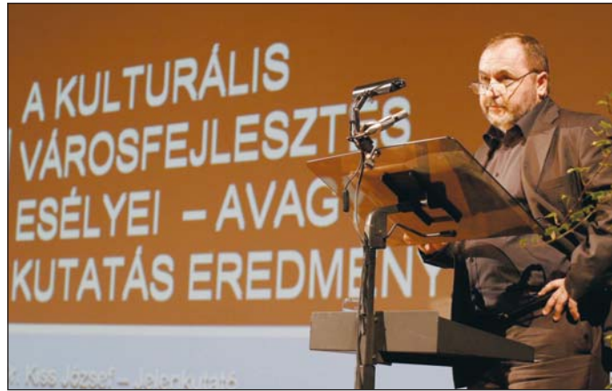
A kulturális városfejlesztés is téma volt a konferencián.

dési intézménye kapcsán, míg korábban ez a szám negyven körül volt. Ugyanakkor százkilencvenhat településen újították meg a művelődési intézményüket. Stratégiai