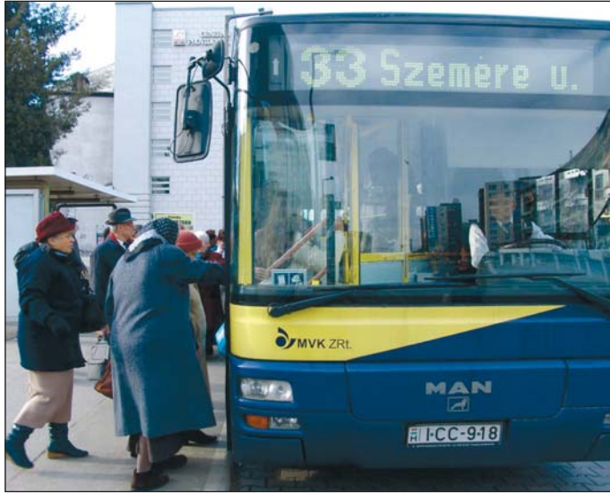
A menetjegyek és bérletek árát hét-nyolc százalékkal tervezi megemelni a közlekedési vállalat.

emeléshez a vállalatcsoport két forint költségmentesítést tett hozzá, így konszolidálva a cégek működését, s közelítve azt az alapításkor megfogalmazott célokhoz.