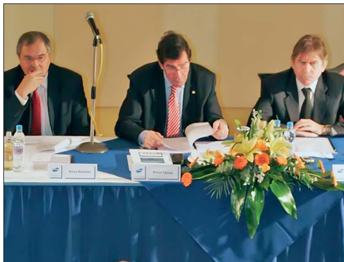
A regionális kamara megalapítása is szóba került.

A küldöttgyűlésen esküt tett a kamara 35 frissen felavatott fodrász, kozmetikus és villanyszerelő mestere, a legkiválóbb gazdálkodó szervezetek képviselői és a kamarai munkában jeleskedő küldöttek pedig a Bokik kitüntetését vehették át.