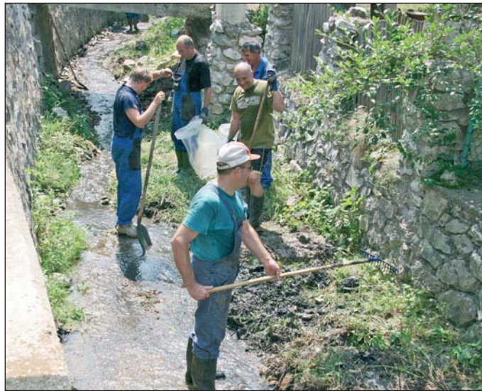
A helyiek is megértették a patak védelmének fontosságát.