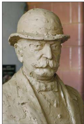
Latabár Endre készülő szobra.