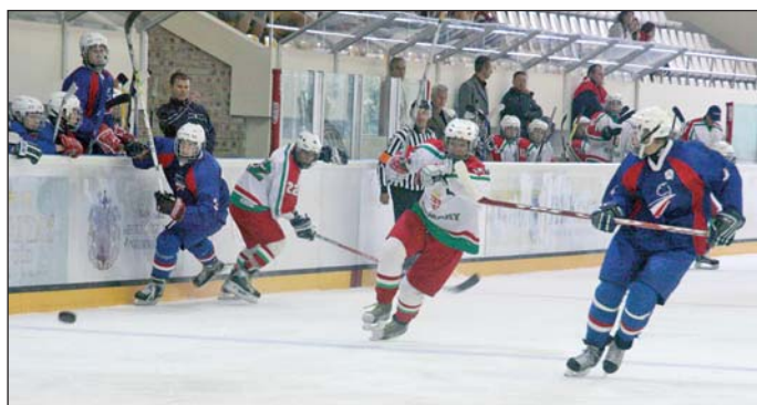
A francia együttest 3-1-re győztük le.