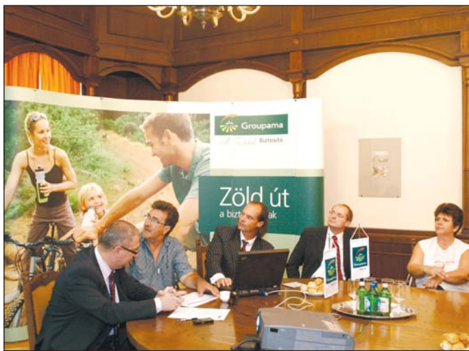
Siker esetén a Barlangfürdőnél és a Népkertben állítanak fel kerékpártárolókat.

A program fővédnöke, Fedor Vilmos alpolgármester elmondta: a városvezetés célja közösségi programokkal, közösségi megmozdulásokkal élénkíteni a vá-