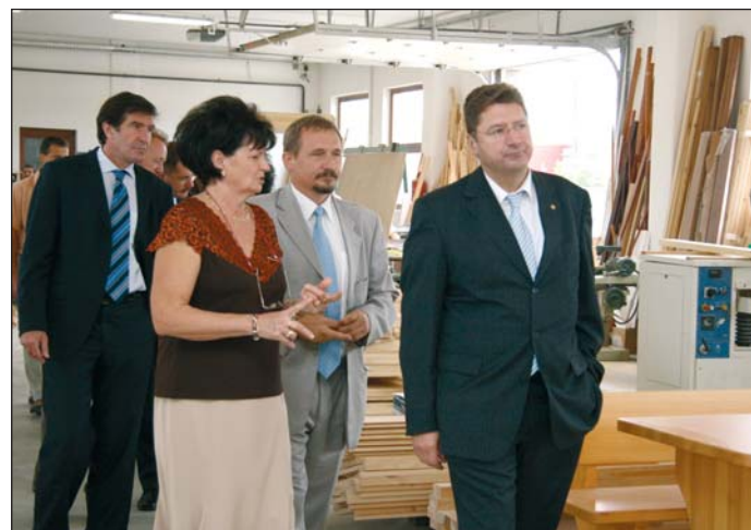
A konferencia résztvevői egy szakképző cég üzemét is felválták.