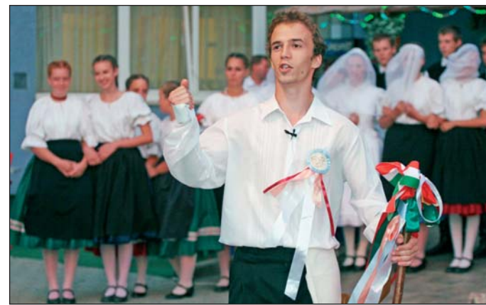
A lakodalmat a népszokásokhoz híven ülték meg.