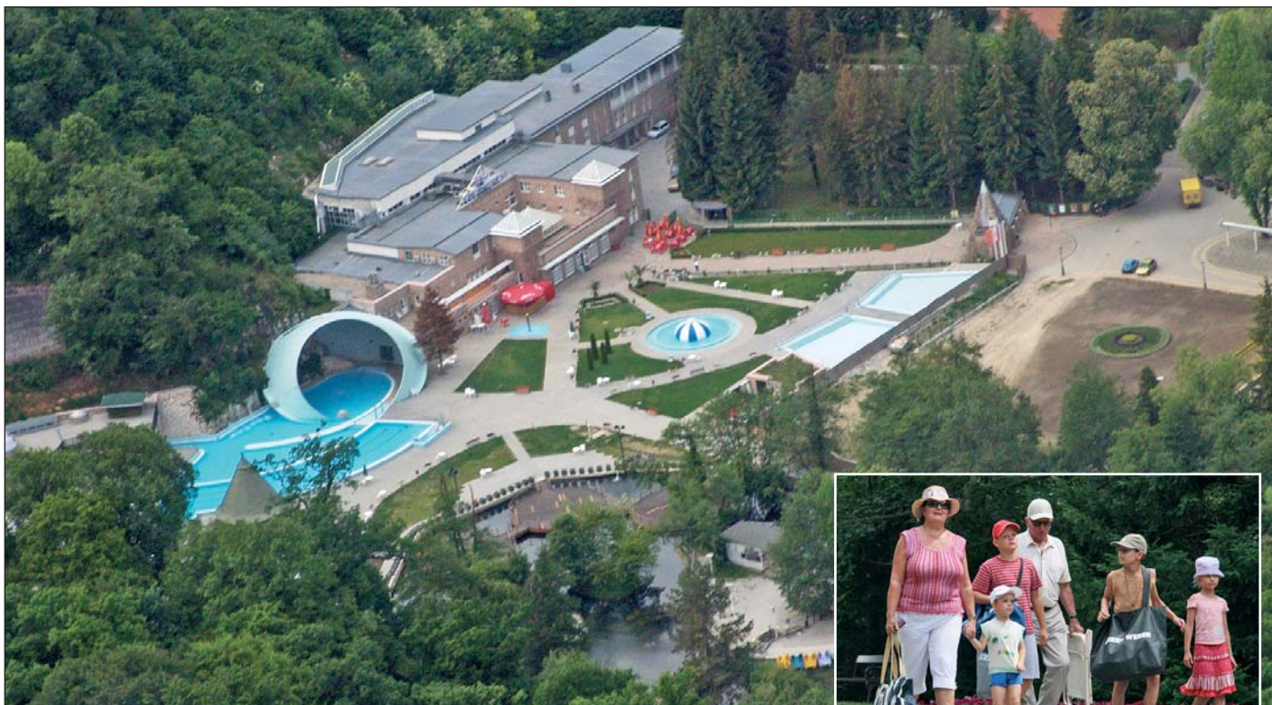
Virágosításra, parkosításra is lehet pályázni.

Összesen csaknem nyolc és félmillió forinttal támogatják az Idegenforgalmi Alapból azokat a turisztikai pályázatokat, amelyeket helyi vállalkozások, egyesületek, alapítványok nyújthattak be tevékenységük fejlesztéséhez.