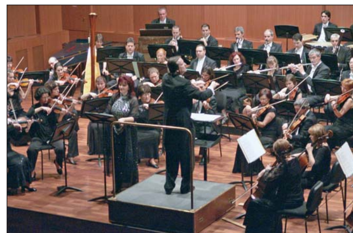
Nem ritka, hogy a határon túlról is érkezik jegyrendelés.

Bemutakozik majd az Eredeti Doni Kozákok társulata, fellép az Experidance Táncgyűttes, a Rajkó Művészgyűttes, a Botafogó Táncgyűttes, a Honvéd Táncszínház. „Kortárs kedd” sorozatnév alatt keddenként kortárs művészek állnak majd színpadra, a gyerekeknek pedig „Mesés vasárnap” néven indítanak programot.