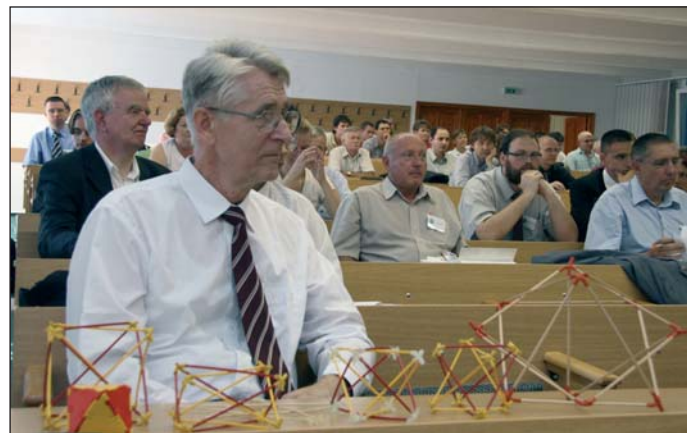
A szakemberek az új eredményeket, kutatásokat mutatták be.

A konferencián ezúttal összesen 111 előadást hallhattak a résztvevők 26 szekcióban. A mechanika területén dolgozó hazai és a környező országokból érkező magyar szakemberek tudományos fórumán az új eredményeket, kutatásokat mutatták be, vitatták meg: egyebek mellett az építőipar és a gépipar számára fontos alkalmazási lehetőségeket, valamint a mechanika egyetemi és főiskolai oktatásának a felsőoktatás átalakításával, az úgynevezett Bolognai folyamattal kapcsolatos sürgető kérdéseit. Az előadók között tapasztalt, ismert és elismert szakemberek, illetve doktorandusz-hallgatók egyaránt szerepeltek. A Miskolci Egyetemen folyó mechanikai kutatások elismerése, hogy a három plenáris előadás egyikét Bertóti Edgár, a Mechanikai Tanszék tanszékvezető professzora tartotta. A Miskolci Egyetem professzorai mellett számot adtak ér-