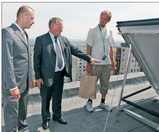
Több mint ezer forint melegvízdíjat takaríthatnak meg lakásonként.