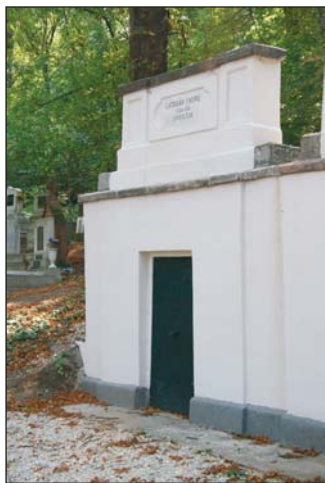
A színészdinasztia nyughelye.