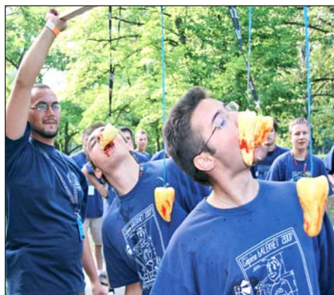
A beavatáshoz mókás vetélkedők is tartoznak.

Hircsu Ákos, a Miskolci Egyetem Hallgatói Önkormányzatának alelnöke elmondta: náluk is hagyományosan jó hangulatban, nagy érdeklődés mellett zajlottak a Gólyatábor, azaz a bALEKHÉT programjai. Volt szakmai nap, amikor az újdonsült hallgatók betekintést nyerhettek az egyetemi adminisztrációba, ügyintézésbe, választott karuk és tanszékük működésébe, tevékenységébe. Emellett volt sportnap, szerveztek környékbeli túrákat, főzőversenyt, koncerteket, játékos, és kevésbé játékos vetélkedőket. Az idősebb hallgatók közül több mint 300 szervező segítette az „újoncok” el-