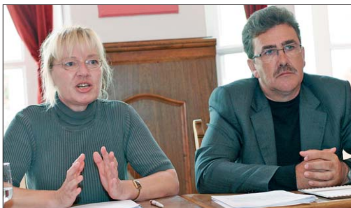
Miskolc koordinálja a partnervárosok együttműködését.