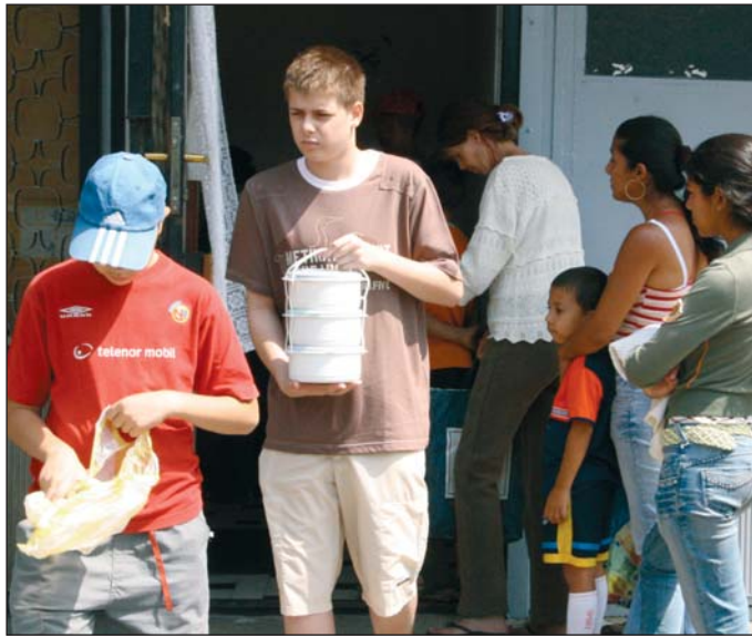
Száz rászoruló gyermeknek biztosítanak meleg ételt.