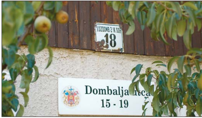
A Dombalja utca 18. szám, amely kis híján a tűz martaléka lett 2004-ben.