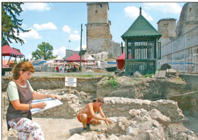
Lassan kirajzolódik az elővár alaprajza.

A szakemberek régóta sejtik: az alaposan feltöltött udvar ezen része rejt valamit. Kiderült, amikor befejeződött a diósgyőri vár feltárása, a várudvar nyugati kerítését középkori falakra építették. Ezt azonban nem dokumentálták megfelelően, s több mint 30 év elteltével új ásásokkal kellett igazolni, hogy a kerítés alatt valóban ott a középkori fal, amely a huszárvárhoz tartozhatott. Ahogy haladtak az ásással a kerítéstől az udvar felé, kirajzolódott a merőleges falak és az átjárást biztosító ajtónyílások, küszöbök, padlók maradványai. A feltárás jelenleg körülbelül 400 négyzetméteren folyik. A napvilágra került helyiségek kis alapterülete komoly fejtörést okoz a régészeknek. Lovász Emese szerint ugyanis a földszinten voltak a lóistállók, ezek a helyiségek azonban méretükönél fogva nem lehetnek erre alkalmasak – de kaszárnyának sem. Egyelőre az is rejtély, emelethes volt-e az épület. Ami bizonyos: a diósgyőri huszárvárt az 1600-as évektől már úgy emlegetik a feljegyzések, hogy „elpusztult”, „megsemmisült”. Nagy valószínűséggel leégett, a feltárás során találtak elszenesedett gerendákat, ki-