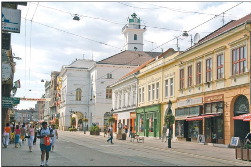
Egyre több épület újul meg – nem mindegy, hogyan.

Arról is jogszabályok rendelkeznek, hogy az esetleges felújítások, átépítések során az eredeti állapot hiteles visszaállítására kell törekedni: ennek része a külső színezés is. A Nemzeti Színház például emberemlékezet óta sárga színű volt, holott nyilvánvaló: ez a késő barokk, klasszicista épület eredeti állapotában nem így nézett ki. Az eredeti színre vonatkozóan viszont semmilyen adat, vagy vakolatminta nem áll rendelkezésre, ezért a legutóbbi felújításkor a színház építési korszakában használatos színek közül lehetett választani. Más esetekben – ide tartozik például az Avast szálló – a felújítás alatt álló ingatlanok tulajdonosai a KÖH előírásai alapján épületkutatást végeztek, amelybe beletartozott az eredeti vakolatszín meghatározása is.