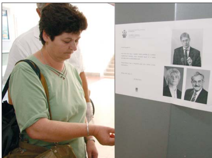
Vizitdíj mellé tájékoztató plakát.