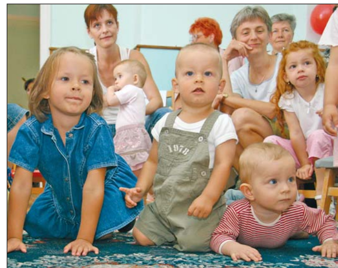
A Kilián déli bölcsődében köszöntötték a kismamákat.