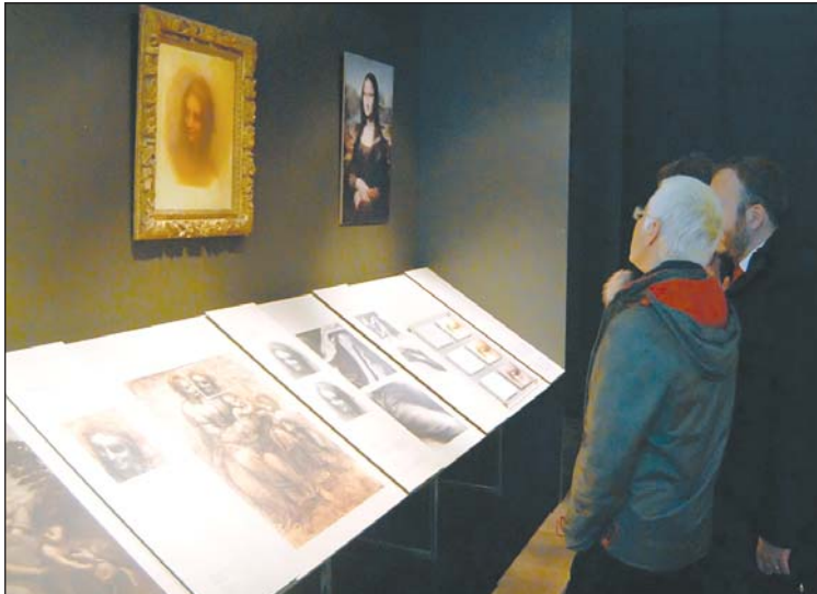
A polihisztor műveiből álló kiállítás először látható vidéken.

A MODEM igazgatója szerint azért is fontos a debreceni Leonardo-kiállítás, mert ez az