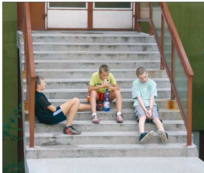
Gyerekek az utcán. A városrészben lakó fiataloknak már épül a közösségi ház.

Barczi András nem tudja pontosan, hány gyermeket érthet ez a probléma az Avason. Tapasztalatai szerint ugyanis a városrész közterein csellengő, kolduló, kukázó tizenévesek meghatározó