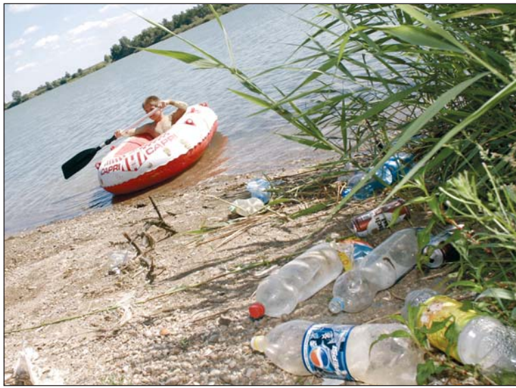
Hiányzik a környezetbarát szemlélet.

Környékünkön főleg a tavaknál okoz gondot a szabadon értelmezett „kempingezés”. Nyékládházának például milliókba kerül évente, hogy a bányatavak környé-