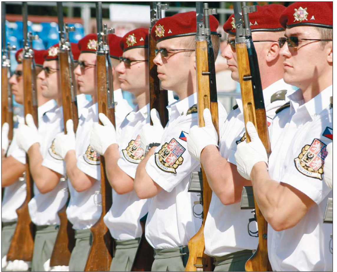
Ők már készen állnak a bemutatóra.

A fesztiválon most első alkalommal társul a díszelgéshez katonazene is, a Magyar Honvédség Központi Zenekara, Hódmezővásárhelyi Helyőrségi Zenekara, Szolnok Légió Zenekara és Székesfehérvár Helyőrségi Zenekara közreműködésével. A programok csütörtökön kezdődtek a „Most jó lenni katonának” című toborzó kiállítással a PPOP Regionális Igazgatóságán. Pénteken 9-től főpróbát tartottak a csapatokkal és zenekarokkal a sportcsarnok előtt. Délután 4-től fél hatig a Szinva teraszon, a Hősök terén és a Városház téren tartottak őrsváltást a díszelgő alegységek, majd felvonultak, és más bemutatókat is lehetett meg látni a belvárosban. Július 28-tól tekinthető meg a minorita templomban a magyar Szent Korona egyik hitelesített