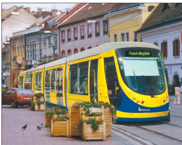
Az MVK látványterve.

Emellett szerepel a tervekben a teljes villamospálya felújítása is, az utastájékoztató eszközökkel, az utasperonokkal és a végállomási épületekkel együtt.