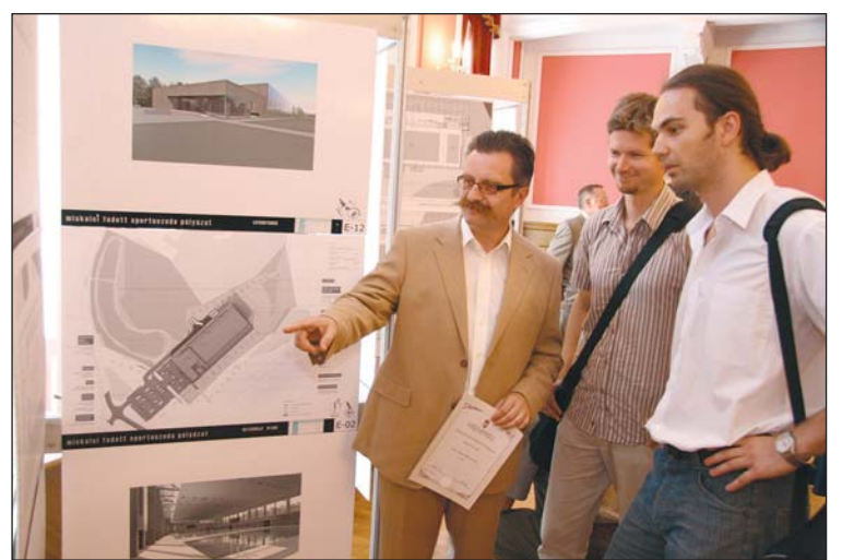
Képünkön az egyik első helyezett csapat.