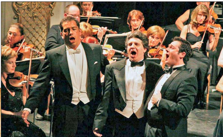
A három tenor koncertje idén is nagy siker volt.