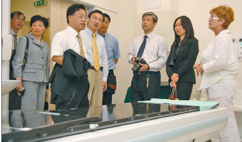
Az állami kórházak működése érdekelte leginkább a delegáció tagjait.

Kínai delegáció látogatott a B.-A.-Z. Megyei Kórházba. A shanghaii orvosok a magyar egészségügyi viszonyok iránt érdeklődtek és szakmai tanácskozáson vettek részt a régió legnagyobb egészségügyi intézményében.