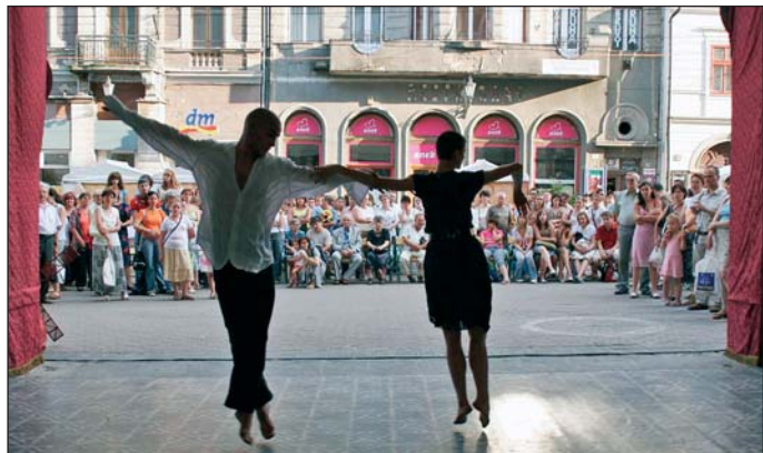
Kár, hogy az operafesztivált elcsúfítja az Aranycsillag méltatlan állapota.