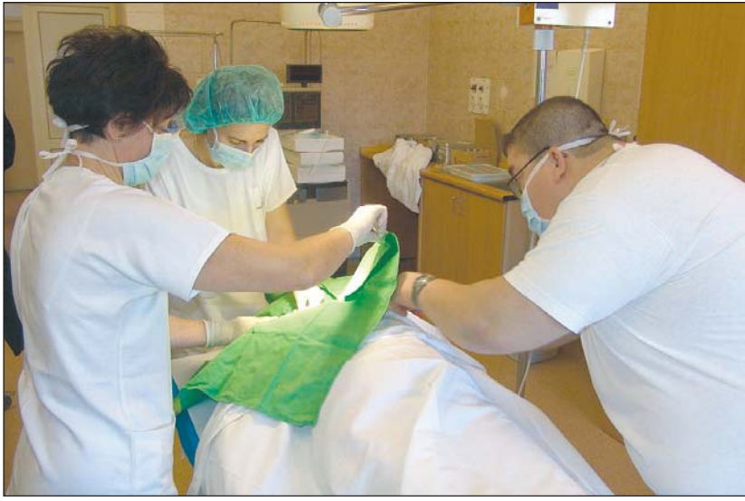
A két miskolci kórház segíti a dialízis-center működését.

– Teljesen egyértelmű, hogy a mai körülmények között hatékony betegellátásról is csak úgy lehet szó, ha az egészségügyi intézmények és a különböző szolgáltatók nagyon szorosan együttműködnek. Így, az egymás közötti tartós kapcsolat és tapasztalatok alapján, a beteg a lehető legrövidebb időn belül, és a legkisebb költséggel, pontos diagnózissal kerül oda, ahol leghamarabb, legmagasabb színvonalon meg tudják gyógyítani – hangsította az alpolgármester. Hozzátette: a klaszter létrehozására 2006 őszén pályáztak, a gondolat eredetileg a Semmelweis Kórház és a Tiszaújvárosi Járóbeteg Szakrendelő együttműködése során érelődött meg. Ezzel keresték fel a dél-borsodi térség különböző