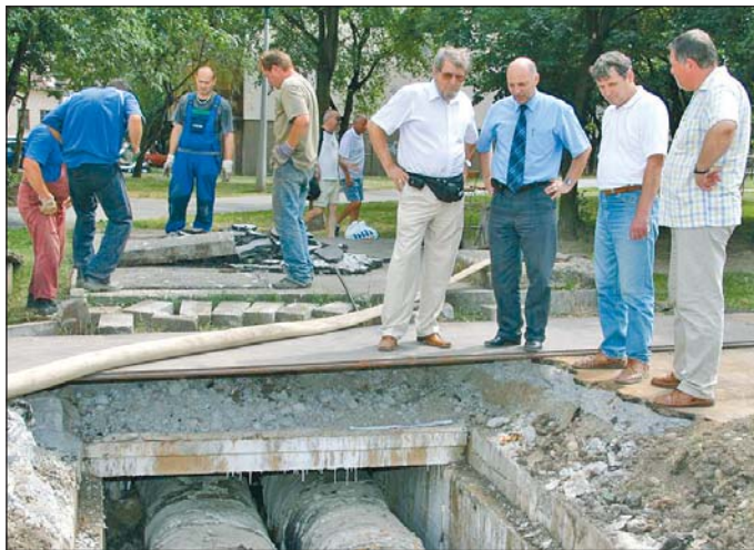
A Vologda utcán hamarabb kényyszeríttek a csőcserére.

– Az elmúlt években megszokhatták a miskolciakat, hogy bár öt napra hirdettük meg a karbantartást, amennyiben hamarabb vé-