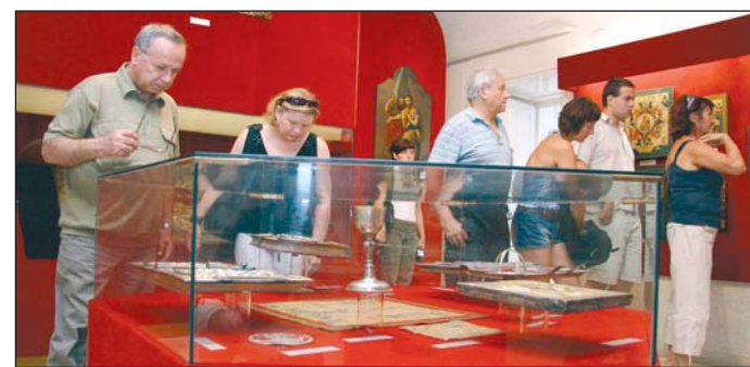
Az egyházi gyűjteményre is elkalauzolták a zsurnalisztákat.

– Miskolc mint egykori ipari város hasonlít a cseh városokhoz. Látni, hogy a város szépen fejlődik, és nagyon igyekszik, a történelmi belvárost is felújítják. Örülök, hogy személyesen is megtapasztalhattam ezeket. A cseh turisták szemében a miskolciak vendégismeretű em-