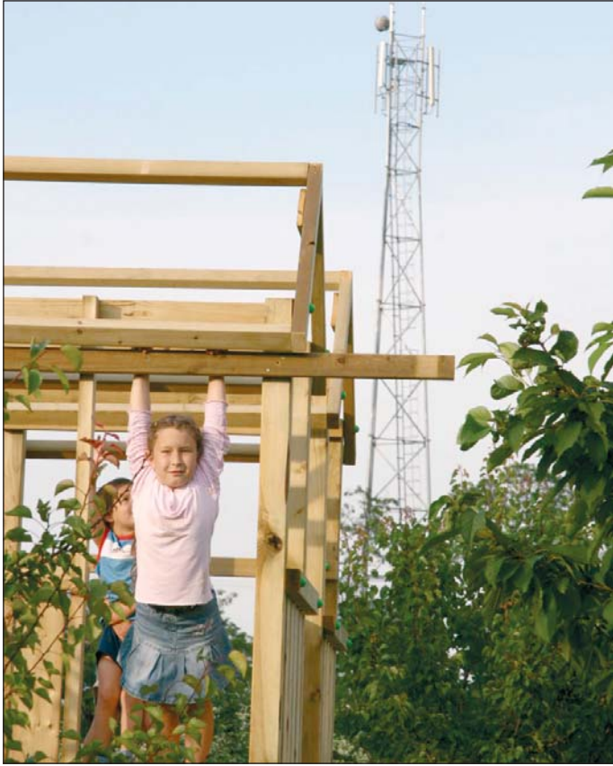
Gyermekeiket féltik a szirmaiak.