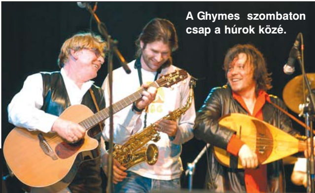
A Ghymes szombaton csap a húrok közé.

vanyújóska” titulust, aki nem moccan be fülig érő szájjal erre a produkcióra!