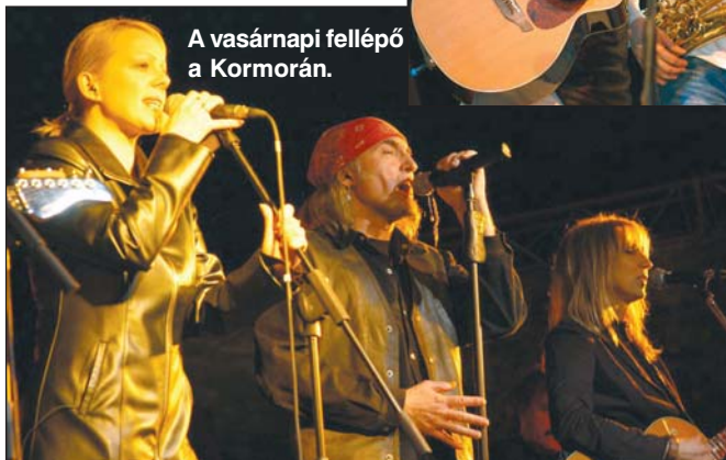
A vasárnapi fellépő a Kormorán.