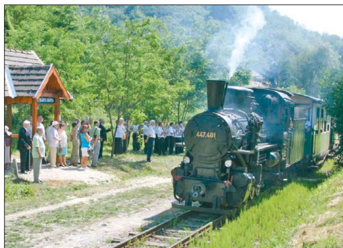
Gőzös szállította az utasokat az emlékhely-avatásra.

– A felnövekvő generációk nem pontosan értették, hogy a környéket miért hívják Mártabányának, és ezért kezdeményeztük a kisvasúttal közösen, hogy állítsuk vissza a régi nevet, akik erre járnak, a fiatalabbak is elolvashatják a tájékoztató táblát, és tudatosul bennük, hogy elődeink a bányászattól, az erre épülő kohászatból és ipari tevékenységből