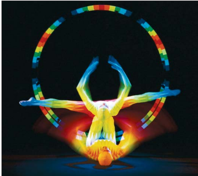
A Black Light Image Theatre előadása igazán látványos volt.

– A Háznak már a kialakítása sem egyezik meg egy átlagos művelődési házával, hiszen nincsenek kamaratermei, amelyek-