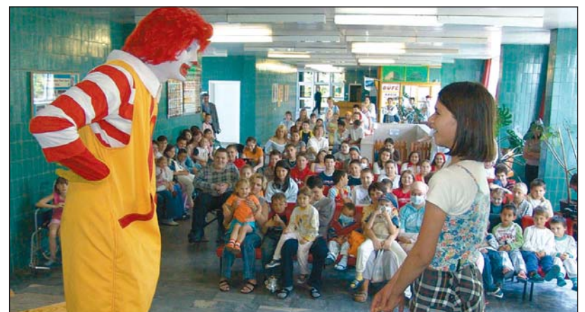
A bohócnak ezúttal is nagy sikere volt.

A szerda délutáni bohócszám is jó hangulatot teremtett, és a produkción nemcsak a legkisebbek szórakoztak jól. A