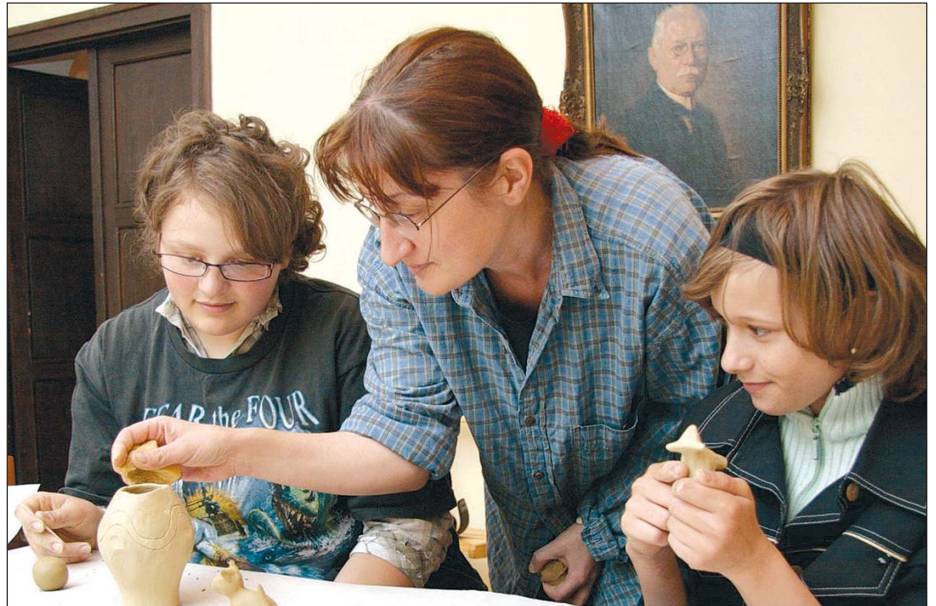
A Papszer utcán kézműves foglalkozással, a Görgeyn új kiállítással ünnepezték a világnapot.