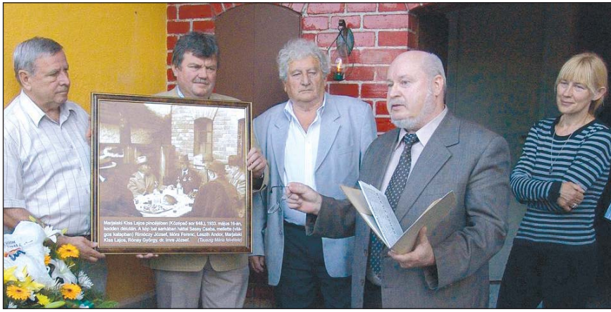
Fotó is megörökítette Móra Ferenc látogatását. Az avatásra a költő dédunokája (jobbra) is ellátogatott.

Ebben a pincében borozgatót és anekdotázózt Móra Ferenc egykor, ha Miskolcra látogatott. Az író Marjalaki Kiss Lajos meghívására 1933-ban vett itt utoljára részt egy baráti találkozóon, mielőtt 54 éves korában meghalt volna. A miskolci barátok már egy