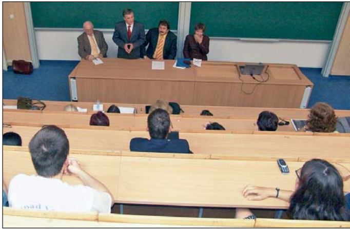
Szociológia Tanszéke, a Tóth Pál Emlékéért Alapítvány és a Miskolci

A szociológiai kutatások eredményeinek hasznosíthatóságáról tanácskoztak a Miskolci Egyetemen a Város, régió, szociológia című konferencián. A találkozón a szakemberek az életminőség és a versenyképesség kérdéseinek megvitatása mellett a régió fejlődésének társadalmi meghatározottságával is foglalkoztak, és immár hagyományosan megemlékeztek Tóth Pál szociológusról is.