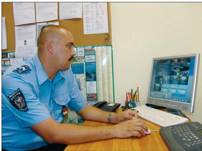
Kiemelt fontosságú az Avason megvalósult kamerarendszer.

A város – a múlt évhez hasonlóan – idén is jelentős összeggel támogatja a bűnmegelőzési tevékenységet. A megvalósult tervek közül a közbiztonsági tanácsnok kiemelte a kamerarendszer kiépítését az Avason