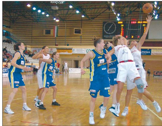
A Városi Szabadidőközpont ad otthont a DKSK mérkőzéseinek is.

– A fejlődéshez a legsürgősebb, hogy költségvetési intézményből alakuljunk át gazdasági társasággá. Akkor lenne lehetőségünk arra, hogy összefogva