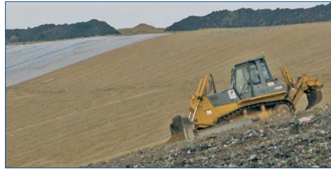
A korábbi szemétheget takarórétegekkel illesztik a tájba.

Miskolcon a szelektív hulladékgyűjtés esetében a gyűjtőszigetes megoldás valósult meg, amely az eltelt évek alatt bizonyította, hogy jól működik. A város országos tekintetben is előkelő helyen áll az egy főre jutó szelektív gyűjtött hulladék terén. Az AVE Miskolc Kft.-nél tervezik a gyűjtőszigetek bővítését, a jövő azonban kétségtelenül az ingatlanonkénti szelektív gyűjtésé lesz. Újdonság azonban, hogy mostantól az italkartonokat is gyűjteni fogják a szelektív szigetek, a szétválogatás után pedig a megfelelő feldolgozóhelyre szállítják. A cég tervei között szerepel egy olyan telep még az idén történő kialakítása is, amely az építési hulladék feldolgozását szolgálja majd. Újabb telepeket alakítanak ki hulladékfeldolgozási célokra is, ami által még kevesebb szemét kerülhetne lerakásra, és több kerülne az iparba, energetikai hasznosításra. Az elképzelés szerint a hulladékot az erőműveknek adnák át tüzelőanyagként. Új tevékenység még a különféle fémek gyűjtése és az iratmegsemmítés is, amely környezetbarát módszerrel, zárt rendszerben történik. Az elszállított papírt az égetés helyett ledarálják, azután pedig bálázzák, és újrahasznosításra eladják a papírgyárak.