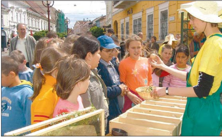
A Városház téren bemutatót is tartottak a komposztálásról.

A komposztálás az egyik legősibb hulladékkezelési módszer, amely ráadásul a környezetet is kíméli, éppen ezért indított programot az eljárás népszerűsítésére a Zöld Kapcsolat Egyesület, Miskolc