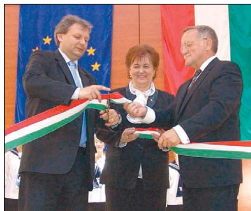
Hiller István (balról), Zsúdel Lászlóné igazgató és Káli Sándor vágta át a szalagot a Ferencziben.

Fontos, hogy a középiskolás diákok kulturált körülmények és jó infrastrukturális viszonyok között tanulhassanak, hogy jó alappal indulhassanak a felsőoktatási intézményekbe – mondta az oktatási és kulturális miniszter miskolci beszédében. Hiller István először az Avasi Gimnázium új épületszárnyának alapkövét tette le. Itt egy nagyrészt állami támogatásból megvalósuló, mintegy kétezer