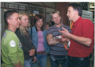
Információk a leghitelesebb forrásból

Napjainkban, a hipermarketek világában, egyre jobban hiányzik az a szakértő segítség, amely egy műszaki berendezés megvásárlásakor elengedhetetlen. A 15 éve számítási- és irodatechnikai szervizként működő Dealer Service szerint nemcsak a vásárlásnál kell segíteni, hanem később is szaktanácsadással, garanciális ügyintézésel.