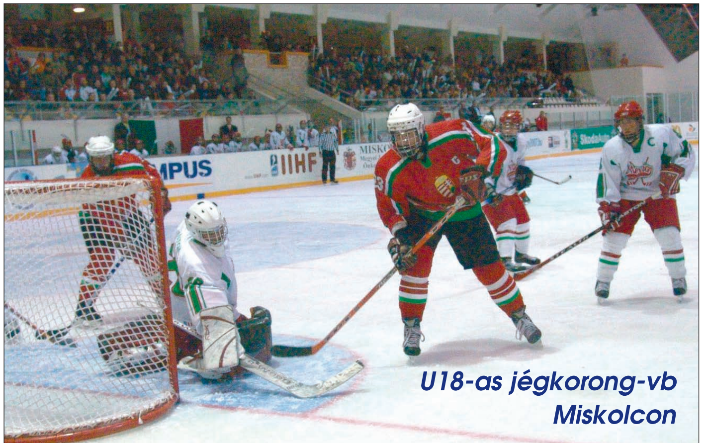
U18-as jégkorong-vb Miskolcon

Szenzációsan szerepelnek a magyar fiatalok a vasárnap óta Miskolcon zajló U18-as divízió II-es, A-csoportos jégkorong-világ bajnokságon! A mieink a lapzártaig lejátszott mindhárom találkozójukat megnyerték és magabiztosan menetelnek az elsőség felé.