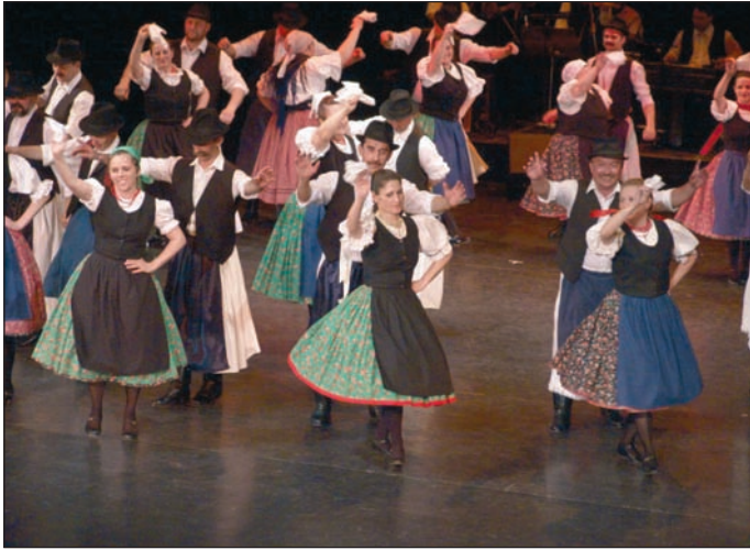
A színpadon egymást váltották a produkciók.

Szombat délután egy óra – a Miskolci Nemzeti Színház épületét szabályszerűen ellepték a táncosok. Minden zugban öltözik, fésülködik valaki, hiszen 120 páros lép színpadra hamarosan. A legidősebbek készülődnek a legkorábban, hiszen elsőként rajtuk a sor, és ahogy telik az idő, úgy egyre fiatalabb és fiatalabb generáció veszi birtokba a porondot. Minden tenyérrnyi helyen ruhák, egyszerű fehér blúzok vagy díszesebb népviseletek lógnak a fogasokon, vagy egyszerűen csak egymásra halmozva fekszenek a kelmék, a kivarrott vagy húzott szoknyák, a falnak, a szék lábának támasztott, még árválkódó bakancsok! Szalagok lógnak innen-onnan, főkötők várják, hogy az öltözködés végén rájuk is sor kerüljön és betakarják a lányok rakoncátlan tincseit vagy az asszonyok gondosan rakott kontyát. Az egyik ö-