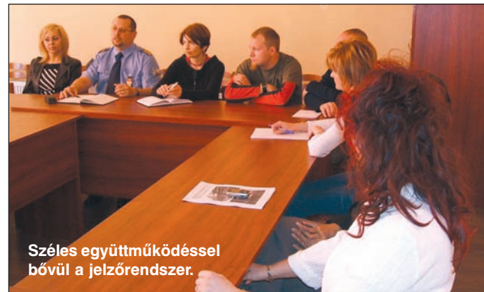
Széles együttműködéssel bővül a jelzőrendszer.

A tájékoztató aktualitását az adta, hogy 2007. január 1-jétől, a hatályos kormányrendelet alapján már nemcsak a főváros és Pest megye területéről, hanem az ország valamennyi régiójából az APEH Kiemelt Adózók Igazgatóságához tartoznak azok a gazdasági társaságok, amelyek az adóévet megelőző év utolsó napján nem álltak csőd eljárás, felszámolás vagy végelszámolás alatt, és számított adóteljesítményük elérte a 2,2 milliárd fo-