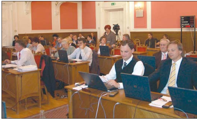
A képviselők több intézmény átalakításáról is döntöttek.

Diósgyőr térségében a Sas utcai tagiskola kerül megszüntetésre, a tanulók a 21. Számú Általános Iskolában, illetve a Móra Ferenc tagiskolában folytathatják tanulmányaikat. Perces térségében a Kuti István tagiskola szűnik meg, az intézmény diákjai a Bulgárföldi Általános Iskolában és az Erenyő tagiskolában tanulhatnak tovább.