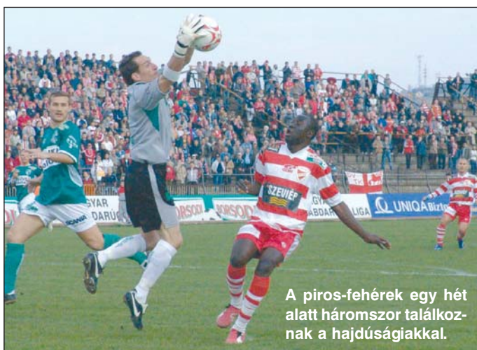
A piros-fehérek egy hét alatt háromszor találkoznak a hajdúságiakkal.

Nos, a DVTK az első 45 percben már el is döntötte a továbbjutást!