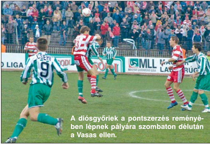
A diósgyőriek a pontszerzés reményében lépnek pályára szombaton délután a Vasas ellen.

Ugyancsak fontos a másik indok is. A diósgyőri klubvezetés mindig figyelembe vette a szurkolók érdekeit. Nos, azt szükségtelen bizonygatni, hogy pénteken jóval kevesebben tudtak volna elutazni Angyalföldre, mint szombaton. A drukkerok egyébként már korábban megszervezték az utat, értesülésünk szerint szurkolóbusz is indul Miskolcra, így az érintettekkel szemben is igazságtalan lett volna a módosítás.