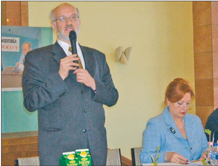
Az államtitkár azt mondja, nem változtatnak a döntésen.

– Minőségi közszolgáltatás minden uniós polgárnak jár, így a magyaroknak is, és elfogadhatatlan, hogy a minőségi közszolgáltatást átalakító reformoknak nevezett struktúraváltást a