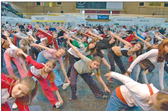
Nagy érdeklődés mellett rendezték meg az elmúlt hétvégén az első Fittségi Sportnapot a sportcsarnokban. Sem programokban, sem mozogni vágyókban nem volt hiány.