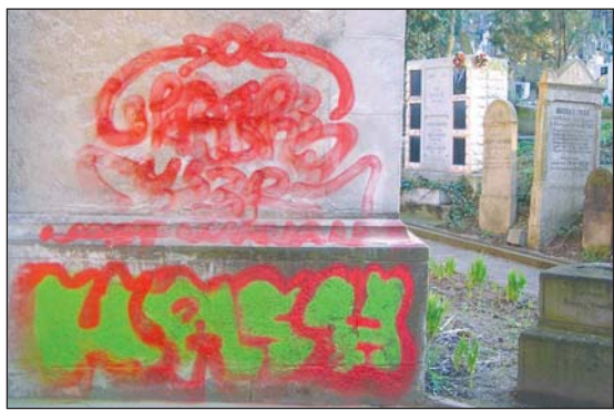
Húsvétra eltűnnek a falfirkák.