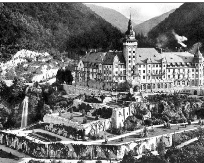
Az egykori függőkert.

A függőkert tisztítása és szépítése aprókékos és pontos munkát igényel, hiszen az édesvízi mészköbe vajt kert támasztja alá a szállót. A sétatény pedig nem a szálló tulajdona, ezért fontos, hogy civilek szervezetek, intézmények és a lakosság közösen veszik kezelésbe.