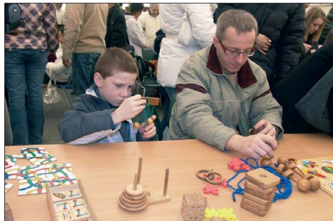
A Csodák Palotája sátrában játékosan tanulhattak kicsi és nagy.

– Többeségük fizikai alapon funkcionál. Úgy mutatjuk itt be a fizikát, ahogy az iskolában, az órá-