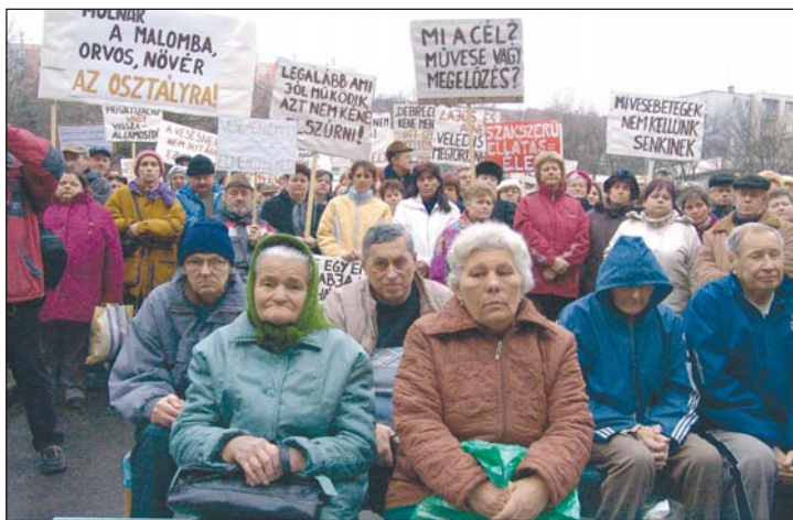
A vesebetegek attól félnek, ha megszűnik a fekvőbeteg-ellátás, a kórházi kezelésért Debrecenre vagy Nyíregyházára kell majd utazniuk.

A betegek attól félnek, hogy ha itt megszüntetik a fekvőbeteg-ellátást, nekik majd Nyíregyházára, vagy Debrecenbe kell utazniuk, ha ilyesmire szorulnak. A központ ve-