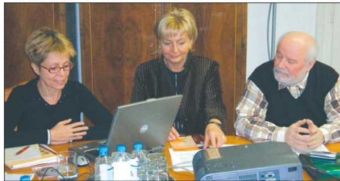
A felmérés adatai szerint egyre jobb Miskolc megítélése.

A Jelenkutató Intézet hat regionális szerepkörrel bíró nagyvárosban: Győrben, Szegeden, Debrecenben, Miskolcon, Nyíregyházán és Pécsen végzett kérdőív vizsgálatokat. Az emberektől egyebek mellett azt kérdezték,