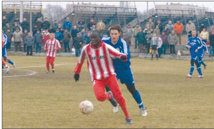
A DVTK jó játékkal és győzelemmel szeretne kedveskedni népes szurkolótáborának.

Zalaegerszezen 2-2-es döntetlennel kezdte a tavaszi idényt a DVTK labdarúgó csapata. A pontszerzés mindenképpen dicséretes, de ha figyelembe vesszük, hogy kétszer is a vendégek vezettek, akár még szebb is lehetett volna a nyitány.