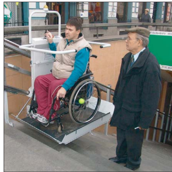
Ezentúl kerekesszékekkel is könnyebb.

Az akadálymentesítési program keretében, február 21-én üzembe helyezték a Búza téri aluljáró személyfelvonóit, amelyekkel a mozgásukban valamilyen okból korlátozottak közlekedését kívánják megkönnyíteni.