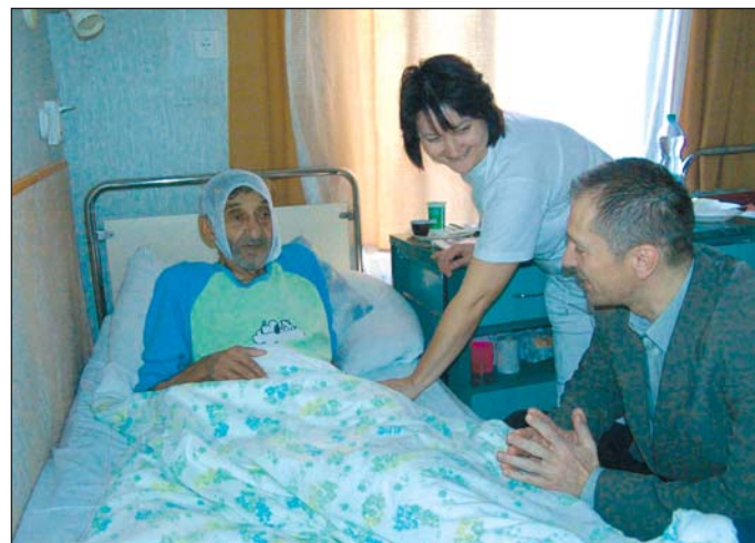
A Hospice tevékenysége nem csak az ápolásra korlátozódik.

Szakmai felkészültség mellett fontos az itt dolgozó emberek