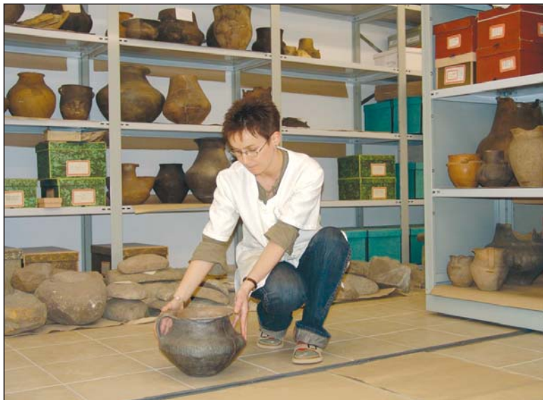
A leletek nagy része a már megújult raktárban kapott helyet.

– Az utóbbi raktárban viszonylag jó körülmények vannak, a múzeum alagsora viszont vizes volt, a rossz körülmények pusztulással fenyegették a leleteket. Annak idején nyilván úgy