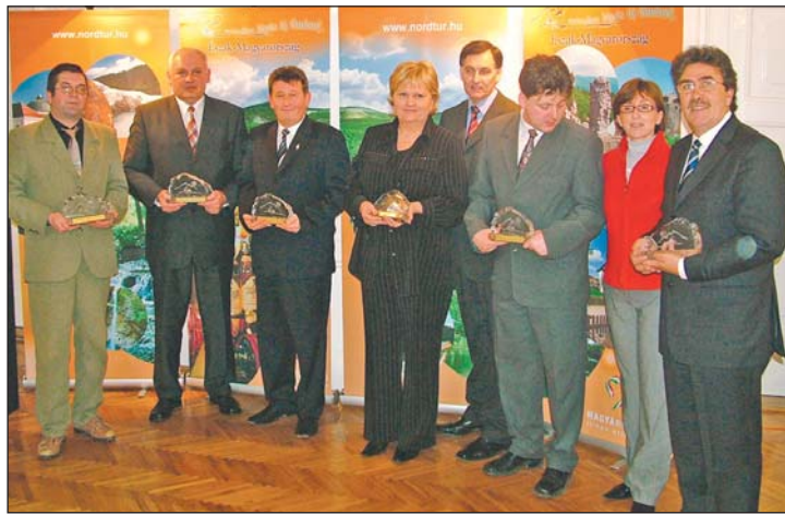
Asz Észak-Magyarország Turizmusáért Nívódíj 2007. díjazottjai.

– Én amit igazán értékelnek tartok, érzek az elmúlt évekből, és talán aminek szívt is ez a nívódíj, hogy Miskolcon elindult olyasmí, amivel az itt élők egyetértenek, és ez a fontos. Örülök persze annak, hogy a külföldieknek tetszik, örülök annak, ha a belföldieknek tetszik, de azon dolgo-