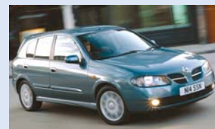
Almera klímával már 2 590 000 Ft-tól