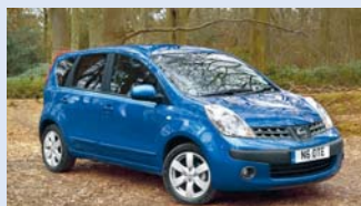
Note gazdag felszereltséggel már 2 690 000 Ft-tól