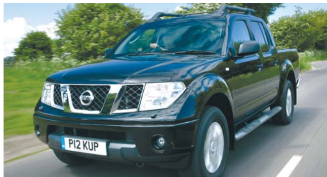
A Navara keménységét külső megjelenésével támasztja alá. Belseje inkább elkényeztetni utasait a SUV-kategóriára jellemző kényelemmel.

A márkakereskedésben a személyautó-paletta teljes skálája