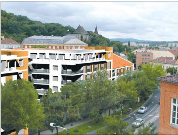
A Verona-ház látványterve.

szerinti, 6 m-es zöldsávot a szomszédok felé, sőt, veszélyeztetni a szomszédságban lévő fákat, köztük egy közel százéves hársfa létét is – hangsúlyozta a hölgy, aki szerint a projekt megvalósultával romlik majd a környezet lakhatósága, jelentősen nő a lég- és zajszennyezés, értékes növények keletkeznek a szomszédos telkeket illetően is.