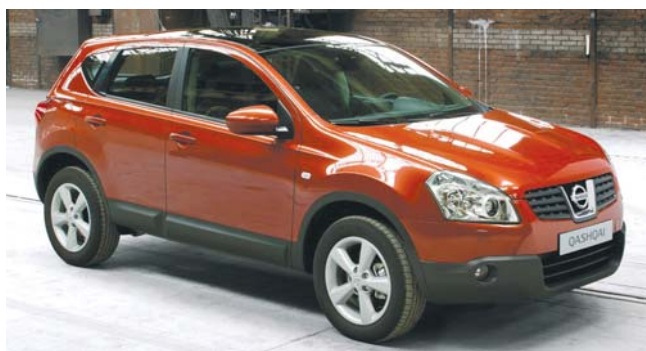
Hamarosan érkezik az új, kompakt méretű szabadidő-autó, a Qashqai.