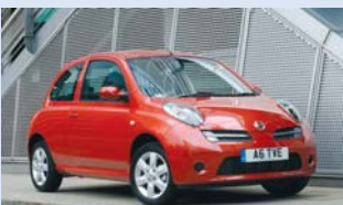
Micra klímával, ABS-szel már 2 390 000 Ft-tól