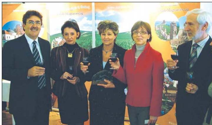
Miskolc képviselői a díjátadáson.