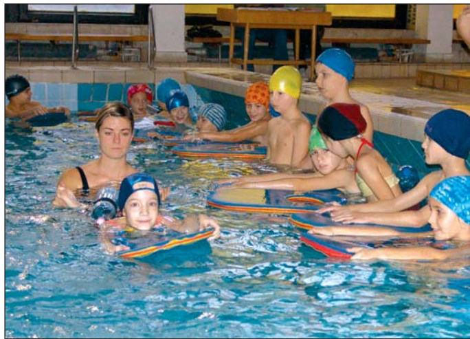
Sok gyerek a városi uszodában tanul meg úszni.