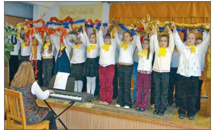
Az Őszi Napsugár Gyermekkoros adott adventi műsort a miskolci Őszi Napsugár Idősek Otthonában.