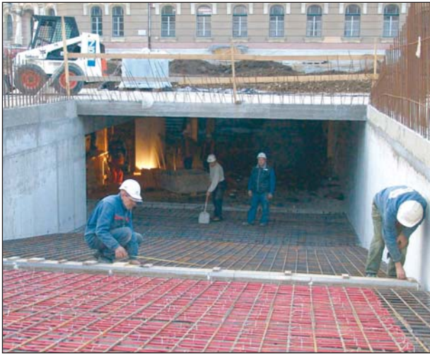
A Hősök terén már a felszíni munkálatok folynak.

úgy döntött, hogy egy koncessziós lehetőséget biztosít egy vállalkozói csoportnak a tér alatti mélygarázs megépítésére. Itt meg kell jegyezni: sok területen a parkolók, parkolóhelyek rovására jöttek létre a belváros megújítását célzó projektek, s a városvezetés egyik legfontosabb célkitűzése, hogy az „elvet” parkolókat mihamarabb visszazakariják a gépkocsival közle-