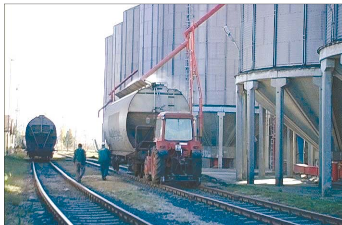
A pályázatok nagy része gépberuházásra szólt.

sítható, hogy a bioprogrammal elsősorban a repce- és a kukorica-termelő vállalkozások járnak jól, de más növények felhasználása is szóba jöhet. Ugyanakkor már most biztosra vehető: agrárirányítási szinten koordinációra van szükség ahhoz, hogy a megépülő feldolgozó alpanyagigénye ne haladja meg a termelési kapacitásokat. Az agrártárca a közel-múltban többször is deklarálta, hogy a befektetési szándékokat össze kívánja hangolni a regionális növénytermelési lehetőségekkel. Ez azonban jól láthatóan nem nyugtatta meg a hazai állattartókat, akik további garanciákat kérnek. A feszültséget az okozza, hogy az állattenyésztő vállalkozásokat a szűkülő piac és jövedelmesség eleve megviselte az elmúlt években, most pedig – újabb csapásként – kigazdálkodhatatlan takarmányár-robbanástól tartanak a biobiznisz erősödése miatt.