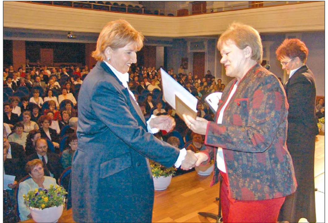
Pénteken a Művészetek Házában elismeréseket vehettek át a szociális területen dolgozók.

Jól működik Miskolcon a szociális háló, hangzott el a Városházán, ami nemcsak az időügyi ellátás fokozatos fejlesztését jelenti, hanem a fiatalokkal való törődést is. A város itthonartásuk érdekében tanulmányi pályázatokkal, lakástámogatással segíti őket az életkezdésben.