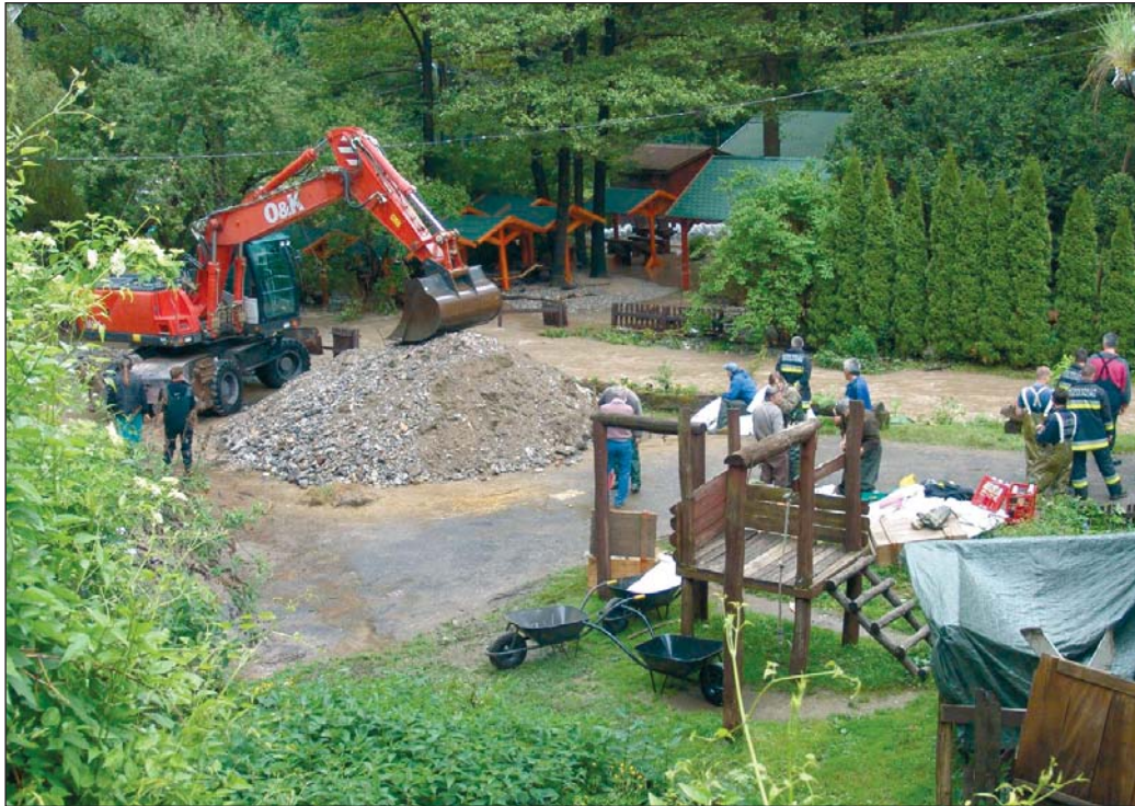
A nyár eleji árvíz hatalmas károkat okozott.

Biztos sokak hűtőládái megteltek itt a nyáron a pisztrángjainkkal – mondja a telep vezetője, aki szerint az áradást követően bárkinek megengedték az in-