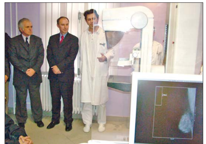
Működés közben is bemutatták az új készüléket.

A mammográf-vizsgálatok az emlő jóindulatú és rosszindulatú