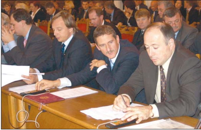
A Diósgyőr labdarúgócsapatának támogatásáról is döntöttek.

A közgyűlésen két napirendi pontban is tárgyaltak a képviselők önkormányzati tulajdonú ingatlanok eladásáról. A szavazáskor zöld utat kapott a Kuruc utca 47. szám alatt jelenleg is élelmszerboltként üzemelő áruház ér-