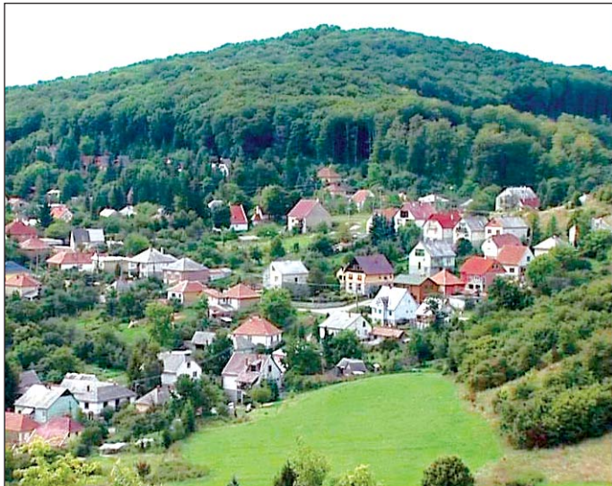
Már nem az elnéptelenedés a fő gond.

– Az előregedés és az elnéptelenedés sajnos elég sok apró faluban már meg is fordult, a sajnos azért mondom, mert nem a javára fordult meg. Pontosán itt, a térségünkben kezdenek olyan területek, falutömbök kialakulni, ahol már korántsem elnéptelenedésről beszélhetünk, hiszen rendkívül dinamikus népességnövekedésről van szó, csak ennek nem nagyon örül-