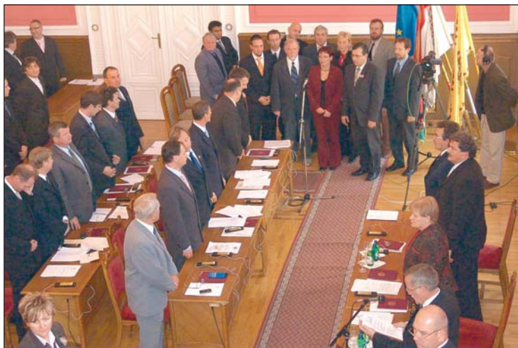
A bizottsági tagok eskütétele.