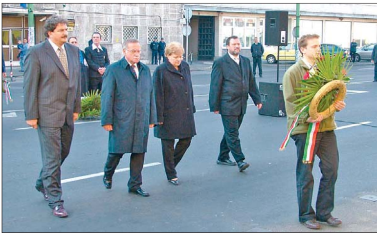
Koszorúzás a Zsolcai kapuban.

Kedden délelőtt folytatódott az 1956-os forradalom 50. évfordulójának tiszteletére szervezett megemlékezések sora. A Dígép falán elhelyezett emléktábla előtt a Dimávac-munkásmegmozdulás emlékére helyezték el koszorút az egybegyűltek. „A mi népünk évszázadokon keresztül tűrte és nyögte a különféle elnyomók által rákényszerített gyarmati rabszol-