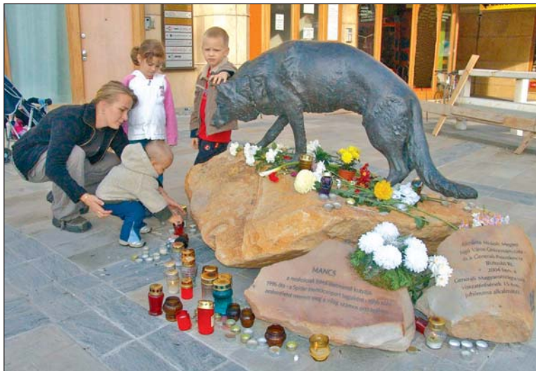
Kegyhely lett a belvárosi szoborból.

Mancsból csak egy volt, őt nem lehet pótolni, így marad meg mindenkinek az emlékezetében – hangsúlyozta a Spider Mentőcsoport frontembere. Mint megtudtuk, az utóbbi négy évben a fárasztóbb feladatokat már a hat-éves, és ugyancsak nagyon tehetséges Radar vette át Mancstól, és az ő szintén Radar nevű kölyke is nagyon ígéretesen fejlődik.