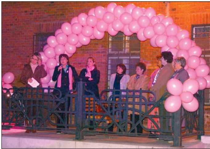
egyértelműen állítják: az idősebbekben felismert mellrák 90 százalékos biztonsággal gyógyítható.

Ma az emlőrák a nők leggyakoribb betegsége. A statisztikák tanúsága szerint Magyarországon évente mintegy 2300 nő halálát okozza a rák ezen fajtája, miközben a szakemberek