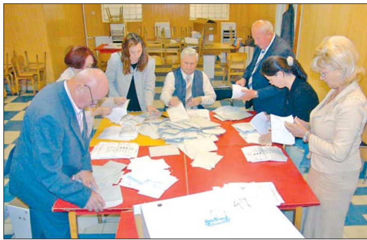
Szavazatszámolás vasárnap este.

A Fidesz-KDNP idén Heves kivételével minden megyei közgyűlésen megszerezte a többséget, az ottani testületbe ugyanis a kormánypártok és az ellenzék is 20-20 képviselőt delegálhat. Borsodban a 10 ezernél nagyobb lélekszámú településeken a 19-ből 10 mandátumot az MSZP 9-et a Fidesz-KDNP szerzett meg. A kisebb lélekszámú településeken viszont a 40 mandátumból 23-at kapott a Fidesz-KDNP és 17-et az MSZP így összesen 32