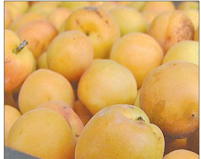
Feldolgozóipari célú beruházásokhoz kínálják a hitelt.

A program hosszú lejáratú forrásokkal finanszírozza a versenyképességet, a minőségi termelést középpontba állító, agrártermékek előállításával, azon termékekhez kapcsolódó szolgáltatások végzésével, saját termelésű produktumok feldolgozásával foglalkozó, magyarországi székhelyű kis- és középvállalatok mezőgazdasági célú beruházásait (a korszerűsítést is), illetve fiatal mezőgazdasági termelők tevékenységének a megkezdését. A hitel összege ag-