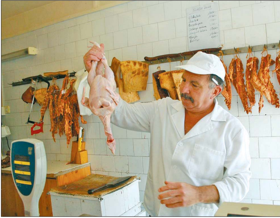
Hazánkban a termőföldtől az asztalig ellenőrzik az élelmiszereket.

– A Magyarországon készített termékek nagy része megfelelő minőségű, nagyon kicsi a kifogásoltsági arány, még az uniós átlagtól is jobb például a növényféléknek a permetezőszer-maradványi arányát tekintve. A kereskedelemben, vendéglátásban sok hiányosságot tapasztaltak az ellenőrök, ezeknek a zöme olyan volt, amit az adott értékesítési hely nagyon könnyen meg tudott volna szüntetni. Lejárt szavatosságú termékek, higiénia hiánya, nem megfelelő tárolás lépett fel elsősorban gondként. Ha olyan a termék, hogy látszik rajta, nem a legfrissebb, akkor inkább ne vásároljuk meg.