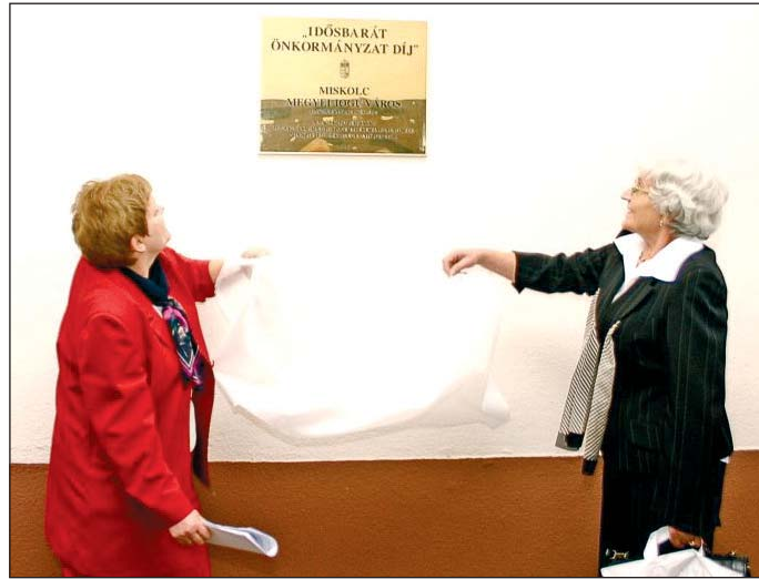
Miskolc elnyerte tavaly az Idősbarát önkormányzat díjat.

– Konkrétan úgy gondoltuk, hogy az önkormányzat, illetve az Időügyi Tanács – az idősek képviselőitől eljárt testület – az Idősek Hava rendezvényeinek kapcsán a város több intézményét, cégét megkeresi, és ajánlatot kér, hogyan, mi módon tudnának bekapcsolódni az eseményekbe. Az Idősek Havának az a jellemzője és célja, hogy ez alatt a négy hét alatt szervezettek bekapcsolódhassanak a szépkorúak a város életébe – hogy alaposabban megismerhessék az egyes területeken folyó munkát, Miskolc közéletét, sportját, kultúráját. Tavaly egyebek mellett szerveztünk túzoltóság-látogatást, Hejőpapi új hulladéklerakójának megtekintését, meglátogattuk a diósgyőri papírgyár múzeumát. Ilyen típusú programok most is lesznek, kiegészülve egy izgalmas látogatással, a megyei rendőr-főkapitányság kiképzőközpontjában. Az Időügyi Tanács már látogatást tett itt, és azt mondták, hogy fantasztikus élményben volt részük.