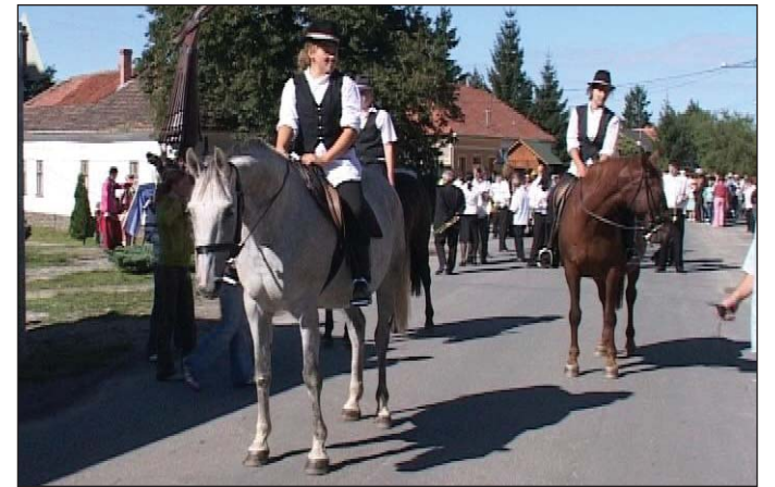
Szüreti felvonulással kezdődött a kétnapos program.

Az Oroszlános borház eredeti funkciója valószínűleg a borkezeléshez kapcsolódott. Erre nem csak a pincében talált nyomokból, hanem a ház alaprajzából is következtettek a felújítást végző szakemberek. A vidékre jellemző klasszicista stílusú épület újjáépítésével és megnyitásával a kulturált borfogyasztást szeretnék népszerűsíteni a hazánk egyik leghíresebb borvidékére látogatók körében.