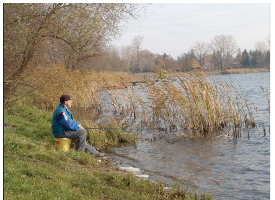
Azért a pecások nagy része engedéllyel horgászik.