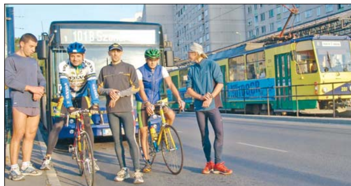
A rajt előtti pillanatok.

Reggel hét óra után egy furcsa verseny indult a diósgyőri villamosvégállomástól. Innen kellett a résztvevőknek eljutniuk a Városház térig futva, kerékpárral, autóval, villamossal és busszal. Leggyorsabbnak a kerekesekek bizonyultak – 14 perc alatt teljesítették a távot. A 101B-sel 18, villamossal 19, autóval 20 perc kellett ugyanehhez. Leglassabbak pedig a futók voltak. A verseny a pénteken kezdődött Európai Mobilitás Hét nyitóeseménye volt. A következő hét napban különféle programokkal várják majd a miskolciakat. A ren-