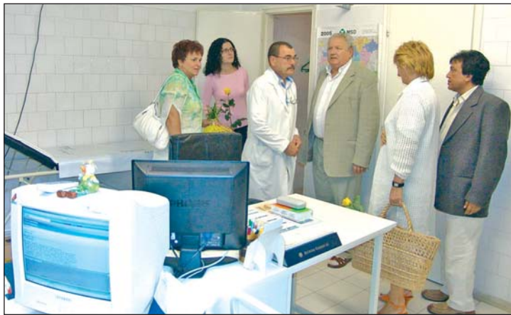
A vendégek megtekintették az intézmény egészségügyi részlegét.