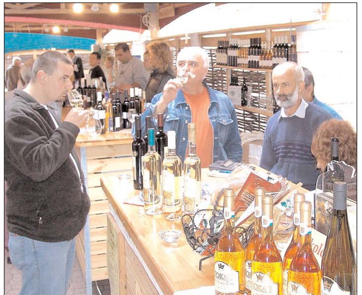
A járulék nagyobb részét marketingcélokra fordítják.

Az idén azonban csonka évvel kell számolni, mert a vázolt lépések csak az őszi második felében lépnek életbe, ám így is több százmillió forinttal kalkulálhatnak, ami várhatóan a jövő év elején áll majd az ágazat rendelkezésére. A megállapodás szerint ugyanis a