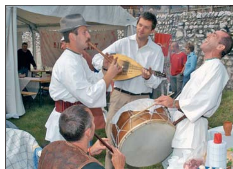
Vidám hangulat a tavalyi rendezvényről.

16-án, szombaton a várárokban népművészeti bemutatók, kirakodóvásár, szórakoztató műsorok várják a látogatókat. A gyerekeknek különleges élményt kínál a nagyapáink korából való kosaras körhinta, amelyet a szülők