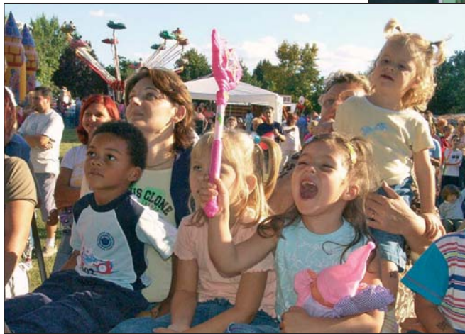
Gyerekegyetemen a Király utcán.

külvárosi lakótelepeken, ahol a lakóknak kevés lehetőségük van a közös ünneplésre. Éppen ezért mindkét helyszínen évről évre nagyobb az érdeklődés a programok iránt.