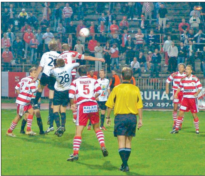
A diósgyőriek szombaton javíthatnak, az újonc Paks vendégeként lehetőség adódik a pontszerzésre.

– Három perc alatt súlyos védelmi kihagyások miatt két gólt kaptunk. Ezért aztán szerfelett nehéz normálisan értékelni a csapat teljesítményét. Úgy láttam, hogy mindenki becsülettel dolgozott, nem kímélte magát. A má-