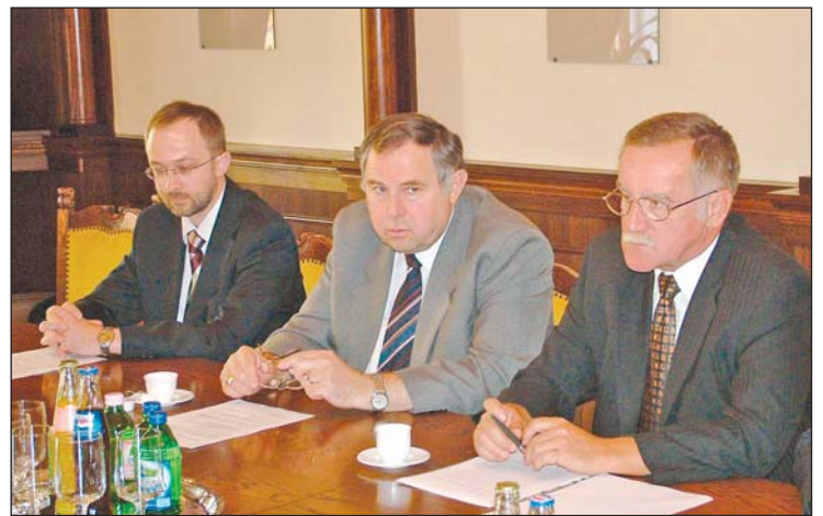
A ZF az egyetemmel és a várossal is szorosan együtt akar működni.

– Az volt a célunk, hogy olyan cégeket találjunk, akik a miskolci fejek és kezek számára hoznak munkát. A Bosch mellett egy