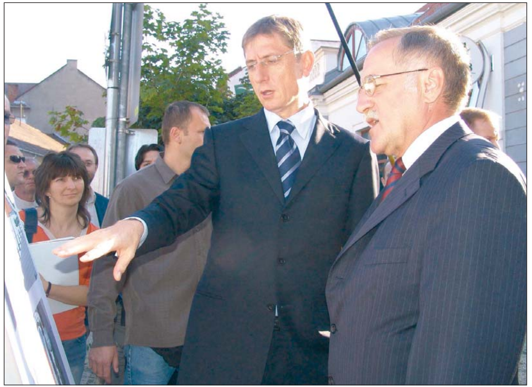
Gyurcsány Ferenc (középen) Káli Sándorral tekintette át a Hősök terének terveit.

A miniszterelnöki konvoj délután fél öt óra tájban érkezett meg a Hősök teréhez. Innen Gyurcsány Ferenc Miskolc vezetőinek kíséretében gyalogos sétára indult a belvárosban, miközben Káli Sándor polgármester a lezajlott és folyamatban lévő helyi fejlesztésekről tájékoztatta. A miniszterelnök megtekintette az átalakított Déryné utcát, majd a színháznál elkanyarodva, a Széchenyi utcán át, a Sötétkapu felé indult a menet. A nemrégiben átadott Művészetek Házánál több százan várták Gyurcsány Ferencet, akit tapsal és ujjongással fogadtak. Káli Sándor beszédében egyebek között utalt arra a városfejlesztési munkára, amelyet négy évvel ezelőtt a „Miskolc, soha ne add fel!” jelmonddal kezdtek, és amelynek látható eredményei nem jöhettek volna létre a kormány segítségével nélkül. A miskolci polgármester köszönetet mondott ezért, s a miniszterelnök további támogatását kérte.