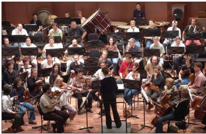
A szimfonikusok már felavatták az új koncerttermet.

– Amikor a választásokat megnyerve bizalmat kaptunk a miskolciaktól, nekem az volt az elképzelésem, hogy a belvárosban próbáljuk megmenteni és összekapcsolni a még meglévő történelmi értékeket – hangoztatta az alpolgármester. – Így alakult ki egy „kulturális négyszög” terve, melynek az első pontja lett a Szinva-terasz, amely mintegy kibontása annak a folyónak, amely humán tengelyként húzódik végig a városon. Innen egy passzázson át eljutunk az első magyar kőszínházhoz, amely mellett sétálóutcat csinálunk. Kialakítjuk a Hősök terét – ezek mind zajló beruházások – majd megfordulunk. Rendbe hozzuk a Batthyány utat, ahol nagyon sok kiállítás található,