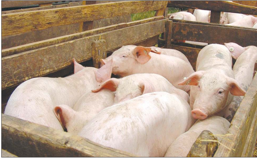
Az élő sertés ára 20 százalékkal emelkedett a nyáron.

A szövetség szerdán az MTI-hez eljuttatott közleményében kifejti: a vágóhidak és húsfeldolgozók költségeit jelentősen növeli az ipar által felhasznált energiahordozók árának emelkedése, a adóteher-növelésről szóló döntés. A forint euróhoz mért árfolyamának gyengülése nemcsak a devizában felvett adóságok törlesztőrészeit emeli meg, hanem a termelés folyamán felhasznált importból származó anyagok árait is. Az elmúlt hónapok, de különösen az elmúlt hetek során a keresleti piac miatt az egész Európai Unióban jelentősen megemelkedett az élősertés, illetve a sertéshús alap-