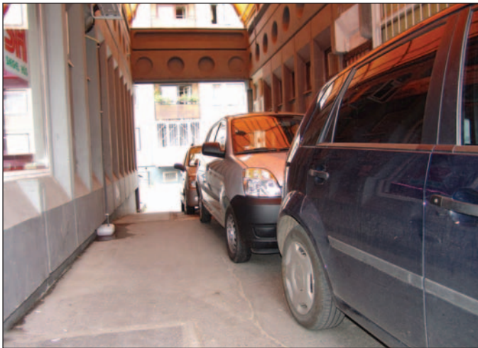
Az autókak lehetetlennek tűnő helyekre is beálltak.

varokat, viharos széllekedéseket okozott. A vihar fákat döntött ki, a hirtelen lezúdult eső utcákat és pincéket árasztott el a nyugati és a közép-magyarországi megyékben. Az intenzív zivatarlánc fokozatosan kelet felé vonult, a zivatartartományok előbbé viharos széllekedések előzték meg, egyes helyekre jégeső, felhőszakadás zúdult. A vihar leginkább Vas, Tolna, Veszprém, Somogy, Fejér és Bács-Kiskun megyét érintette. Májig tisztázatlan körülmények között olyan hírek terjedtek el, hogy az ítéletidő Miskolc felé tart, s óriási jégesőt okoz majd a városban. A vihar azonban végül elkerülte Miskolcot, a hidegfronttal érkező zivatarsávnak csak a széle érintette Borsod-Abaúj-Zemplén megyét. A korábbi tapasztalatok