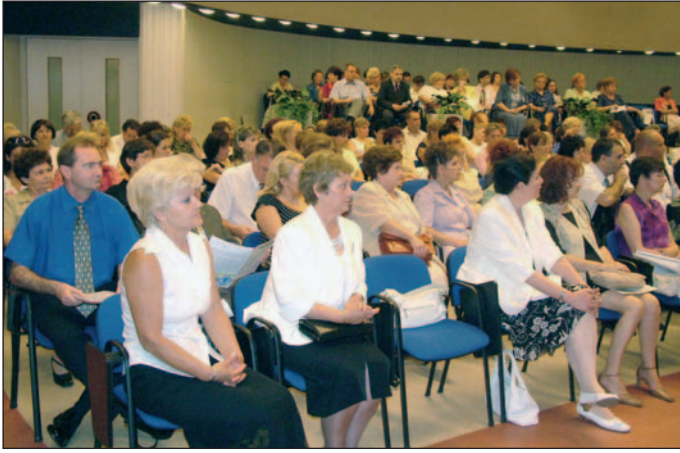
A egészségügyi dolgozók ünnepeltek.

Így például a megelőzés, a rehabilitáció területén vannak lehetőségei a vállalkozásoknak, de a táplálkozással és szépséggel kapcsolatos, az egészségügyi szolgáltatásokat kiegészítő tevékeny-