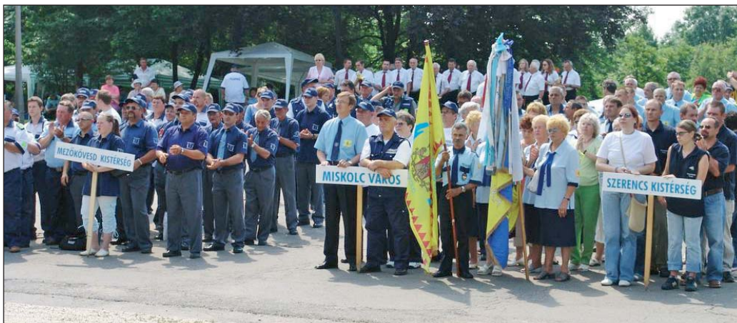
A polgárőrnap a szervezetek felvonulásával kezdődött.

Az ország mintegy 74 ezer tagot számláló polgárőrszövetségének tíz százalékát a Borsod-Abaúj-Zemplén megyei szervezet adja, amely elsőként alakult 1991-ben. Vállalásuk, hogy a rendőrség, a határőrség, a katasztrófavédelem tevékenységét önkéntes munkával segítik. A készülő közigazgatási reform újabb feladatokat ró a polgárőrökre, akiknek munkáját 2006 tavaszától törvény szabályozza. A