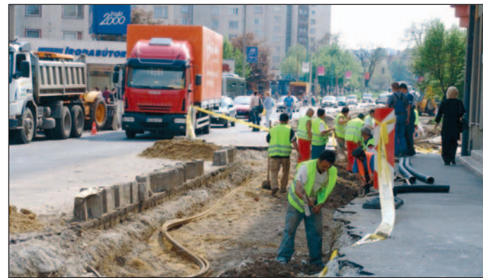
Gőzerővel folyik a munka a Corvin utcában.