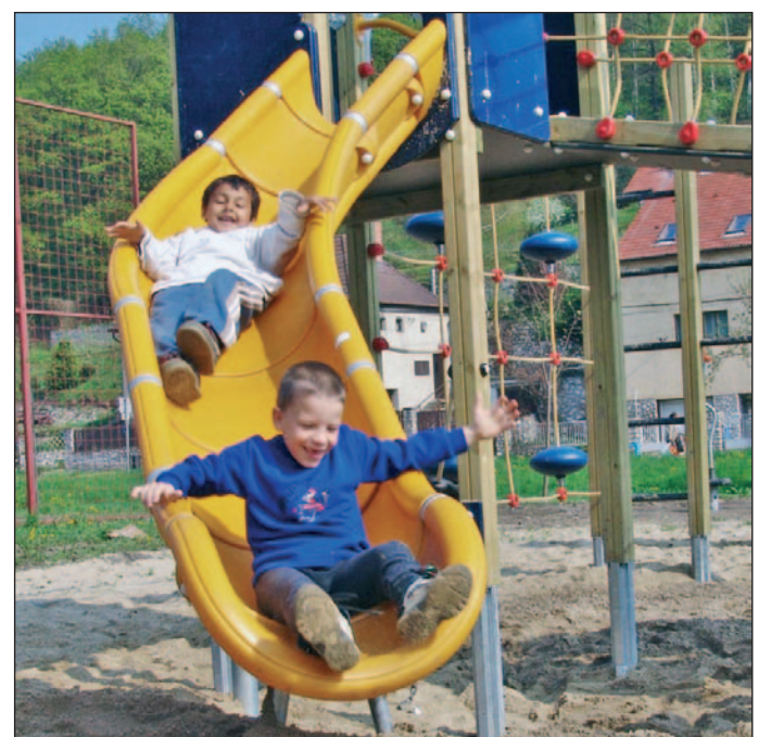
Az új játszótérrel az apróságok már birtokba vették.

Az elmúlt évben négy, az európai és magyar szabványoknak is megfelelő ilyen létesítménnyel gazdagodott a város, emellett pedig kilenc másik miskolci játszótér átépítésére, felújítására készültek tervek. Ezek között szerepelt a Szentpéteri kapui lakótelepen található – melyet nemrégiben adták át – és a percesi is. Bazin Géza, a terület önkormányzati képviselője lapunknak elmondta, 2003-ban a percesi részönkormányzat már létrehozott itt egy játszótérrel, ennek eszközei most átkerülnek a Debreczeni Márton térre. A helyi beruházások kapcsán a képviselő arról is beszámolt, hogy Percesen új aszfaltzónyot kapott a Bollaúj út, s a nyár folyamán új