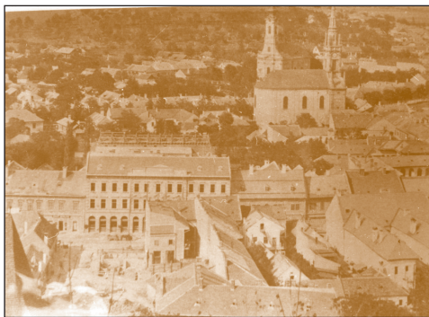
A felújítás fontossá vált épületei az Erzsébet tér környékén a MAB-székház felépülése előtt, 1894.