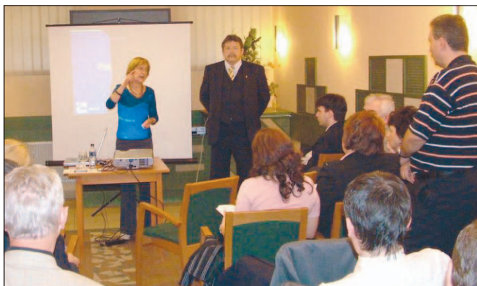
Ingatlanos cégektől, önkormányzatoktól érkeztek a konferenciára.

– A szövetség szervezésében országos előadássorozatot tartunk a március 31-én hatályba lépett lakástörvénnyel kapcsolatban, hogyan kell az önkormányzatok lakásrendeleit összhangba hozni a törvénnyel. A miskolci konferencián Nógrádtól Hajdú-Bihar megyéig az északi régió önkormányzatai ingatlanforgalmazási cégeinek a szakemberei, valamint néhány önkormányzat szakembere vett részt – tudtuk meg