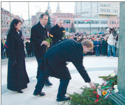
A nemzeti szolidaritás fontosságát hangsúlyozták.