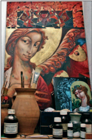
Pillanatkép Vágóék műhelyéből.

– A tengerentúlon valóban elismerik tevékenységünket, ha megjelenünk egy-egy fesztiválon, megkeresnek minket, gratulálnak, vá-