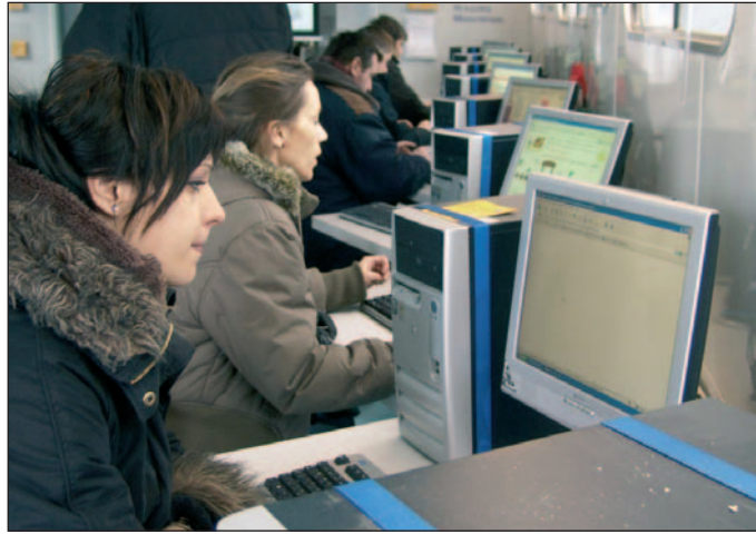
Bárki kipróbálhatta a szélessávú internetet.