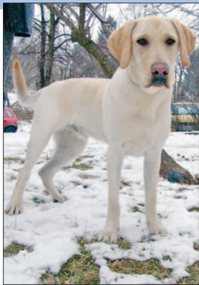
Az állatok is megsínylik a hideget.

annak tulajdonítható, hogy egyre szélesebb körben ismert a védőoltás védőhatása és egyre többen élnek ezzel a lehetőséggel – tette hozzá dr. Karázi. A megfelelő táplálkozásról és a vitaminok beviteléről sem szabad persze télen elfeledkezni egészségünk védelme érdekében.