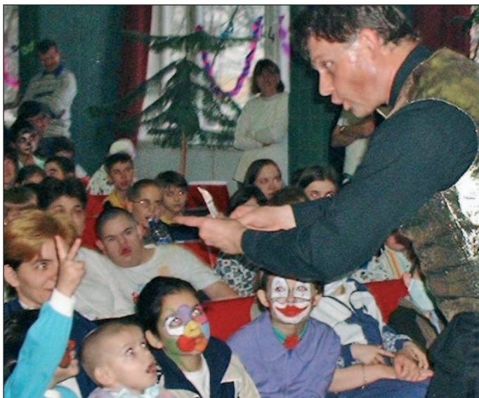
A farsang ma már elsősorban a gyerekek ünnepe.

A farsang sok évszázaddal ezelőtt a tavaszvárás pogány kori ünnepeiből nőtt ki. Magyarországon Mátyás udvarában váltak divatosak az itáliai mintákat követő álarcos mulatságok, II. Lajos udvarában harci játékokat is rendeztek az ünnep tiszteletére. Az egyház kezdetben rossz szemmel nézte az időnként szabados mulatozást, de megfékezni nem tudta ezeket. Olyannyira nem, hogy a farsangnak köszönhetjük a magyarországi népi színház kialakulását is. A 20. században az ünnep állandó jegyeket öltött, akkor terjedt el többek között a busójárás szokása. Ezek a nagyobb falvakban tartott álarcos, jelmezes felvonulások, melyeket legtöbbször a farsang utolsó napjaiban rendeztek és rendeznek a mai napig. Egyes