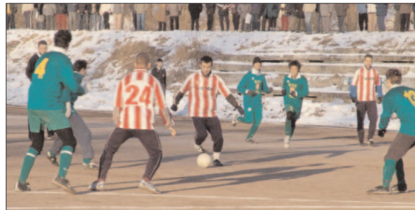
Alakul, formálódik a tavaszi DVTK, de még idő kell, hogy minden „alkatrész” a helyére kerüljön.