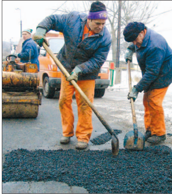
A fagy az utakat sem kíméli, de minden kátyút igyekeznek betömni.

– Talán nyáron végre költözhetünk, bár a közművesítés az új telephelyen sem megoldott – vála-