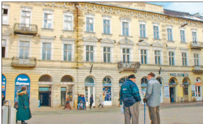
Végre előrelépés történhet az Avas Szálló ügyében.