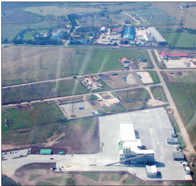
Az ipari park madártávlatból.