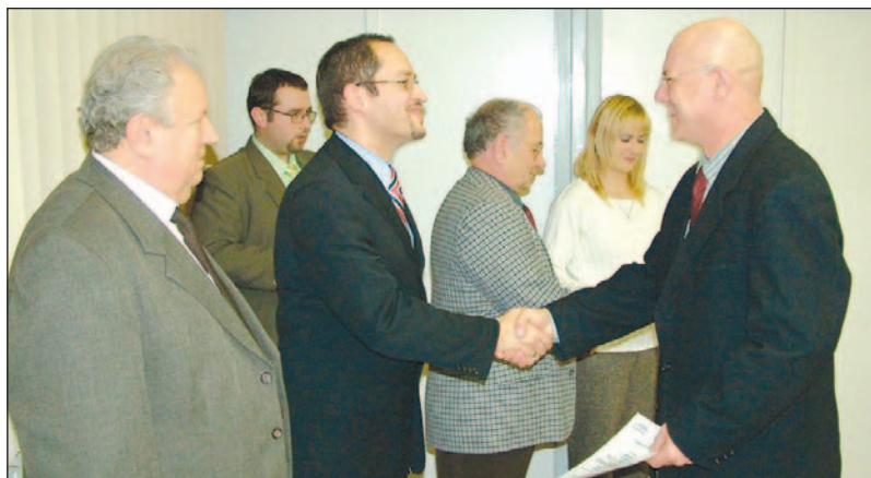
Az első kurzus hallgatói átvehették oklevelüket.

A fiatalok bűnözés, a kábítószerrel kapcsolatos bűncselekmények és a családon belüli erőszak is témája volt a szeptembertől december végéig tartó, havi egy alkalommal rendezett előadásorozatnak. A kurzus