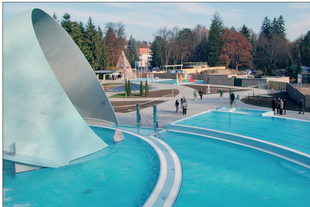
A Barlangfürdőben felújított kagylómedence.