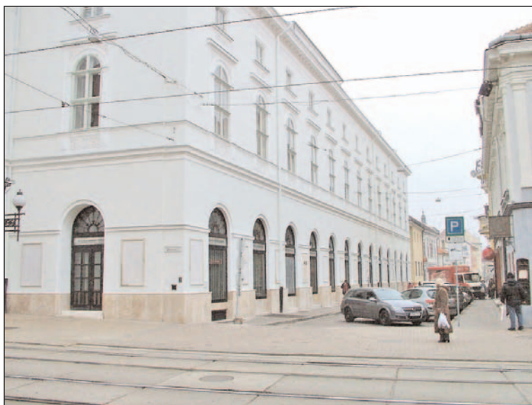
A színház már megújult, a Déryné utca most következik.

2005-ben 1,7 milliárd forintot nyert város a Regionális Operatív