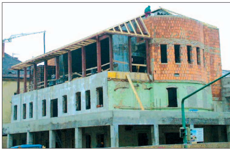
A művészetek házában a nyáron már koncertet tartanak.