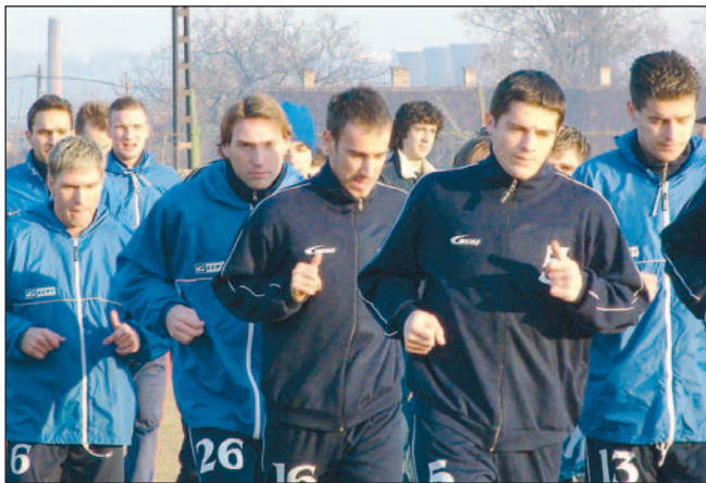
A diósgyőri labdarúgók megkezdtek az erőgyűjtést a tavaszi idény feladataira.