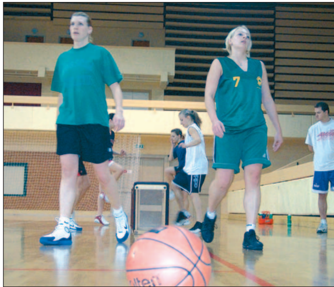
Bár a lányok már edzenek, még nem tudni, kik veszik kézbe a labdát a hét végén.

A DKSK-nál mindössze hét profi maradt, de az egyesületnél továbbra is csak tolják maguk előtt a gondokat, előrelépés azonban nincs. A maradék állomány tagjai jelezték, hogy Miskolcon képzelik