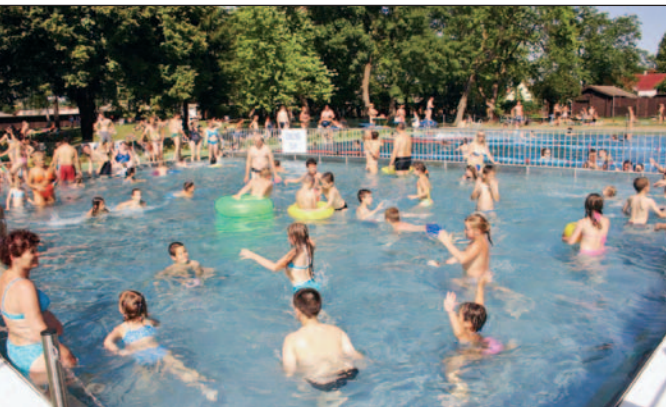
A Diósgyőri strand megújult medencéje.