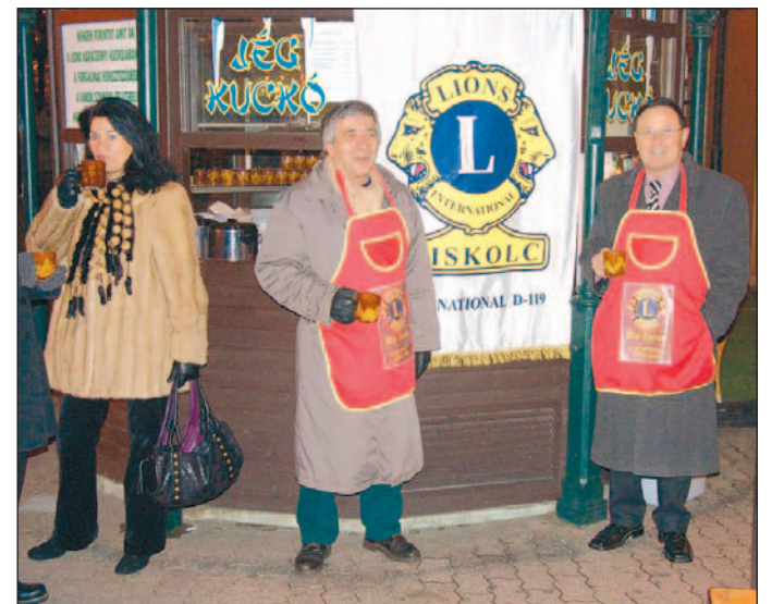
A vak emberek közlekedését segítő jelzőberendezésekre gyűjtenek.

A klubtagok ezt már tudják, hiszen idén decemberben is segítséget kérve fordultak a városiakhoz. A céljuk pénzügyi volt, mégpedig azért, hogy a vakok és gyengén látók számára a forgalmas útkereszteződéseken hangjelző berendezéseket állíthassanak fel 2006-ban. Bár a Pannónia Szállóval közösen létrehozott jótékonyági