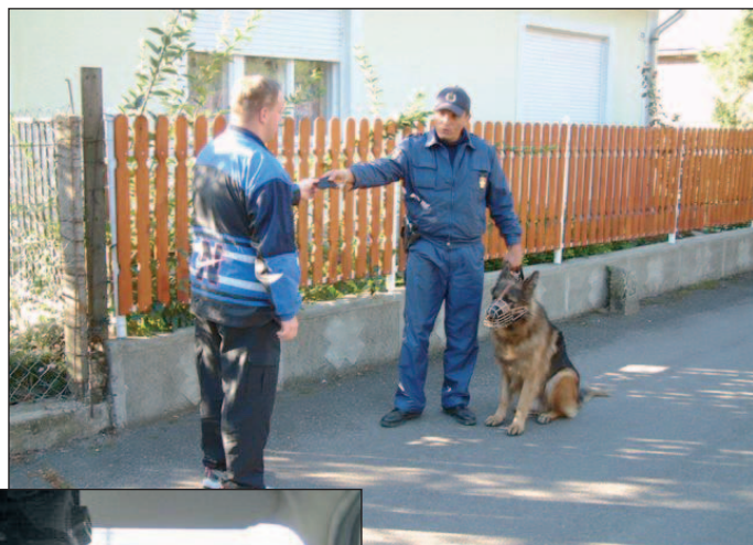
A jövőben új rendőrkutyák állnak munkába.

– Borsodból korábban számos rendőr költözött el – mondja a főkapitány. – Ennek részben az volt az oka, hogy a miskolci iskolában