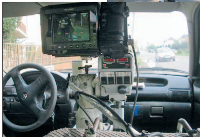
2005 a közlekedési razziki éve volt.

A bűnügyi területen a rendőrség gyors reagálását emelte ki Kőkényesi Antal. Mint mondta, az elkövetők negyven százalékát még a bűncselekmény helyszínén, vagy a közelben elfogják, ami egyértelműen az éber reagálóképességet jelzi. Lapzártánk időpontjában a november végi statisztikai adatok álltak rendelkezésre, amelyek szerint a megyében 25 945 bűncsele-