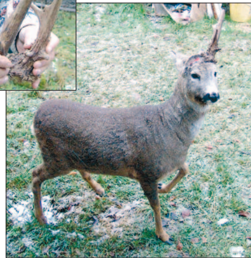
Pityu elhullajtotta az egyik szarvát.