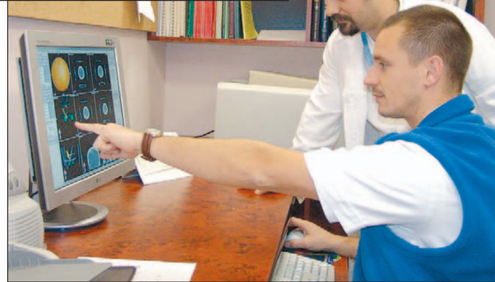
Számítógéppel tervezik meg a beavatkozást.

A stereotaxiás kezelés bővíti a lehetőségeket, ez már nem csupán a koponyát érintő elváltozásoknál alkalmazható, hanem egyéb olyan idegsebészeti beavatkozásoknál is, ahol a hagyományos műtéti eljárással már nem látszik megoldhatónak a daganat eltávolítása. Lerövidül a kezelési idő, időt nyernek a további eredményes te-