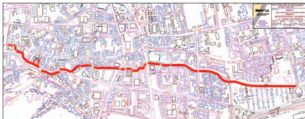
A kerékpárút tervezett nyomvonala.

bítószerek használók, akik közös tüvel adják be maguknak a szert, de a méhben lévő magzat is megfertőződhet, ha az anya vírusos. A Borsod-Abaúj-Zemplén Megyei ÁNTSZ-ben hetente kétszer várják ingyenes szűréssel és tanácsadással az érdeklődőket. Hétfőnként 8–12 óráig, csütörtökön 12–16 óráig veszik le a vizsgálatához szükséges vért.