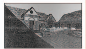
Váltó utcai intézmény látványterve.

A pályázatot benyújtó Miskolci Önkormányzat önrészként a tulajdonában lévő Váltó utcai – egykor iskolai nevelést szolgáló – ingatlant ajánlotta fel, melynek felújításához, funk-