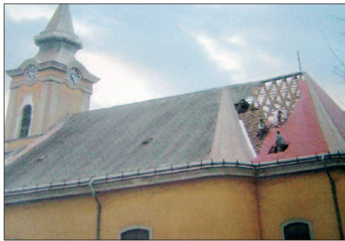
mellénk áll, 2006 májusára minden munkálatait befejezhetünk újjászülött rezidenciánkon – így a lelkes plébános. Sz. V.

– A munka már zajlik, bár hozzá kell tennem, hogy a két épület felújítása közel dupláját követeli az eredetileg kigondolt költségvetésnek, bár még így is olcsóbb, mint ha külön-külön végeznék a feladatokat. A korszerűsítés elkerülhetetlen, a körülbelül 30 millió forintnyi összeget pedig elő kell teremtenünk rá. Zachár plébános úr már kapott a várostól erre 5 millió forintot, én is bízom abban, hogy mind Miskolc városa, mind az érsekség, mind pedig a hívek mellénk állnak a jó ügy érdekében. Hitemből és vallásos meggyőződésemből adódóan azt mondom, hogy nincs mitől tartanunk, a segítő szándék