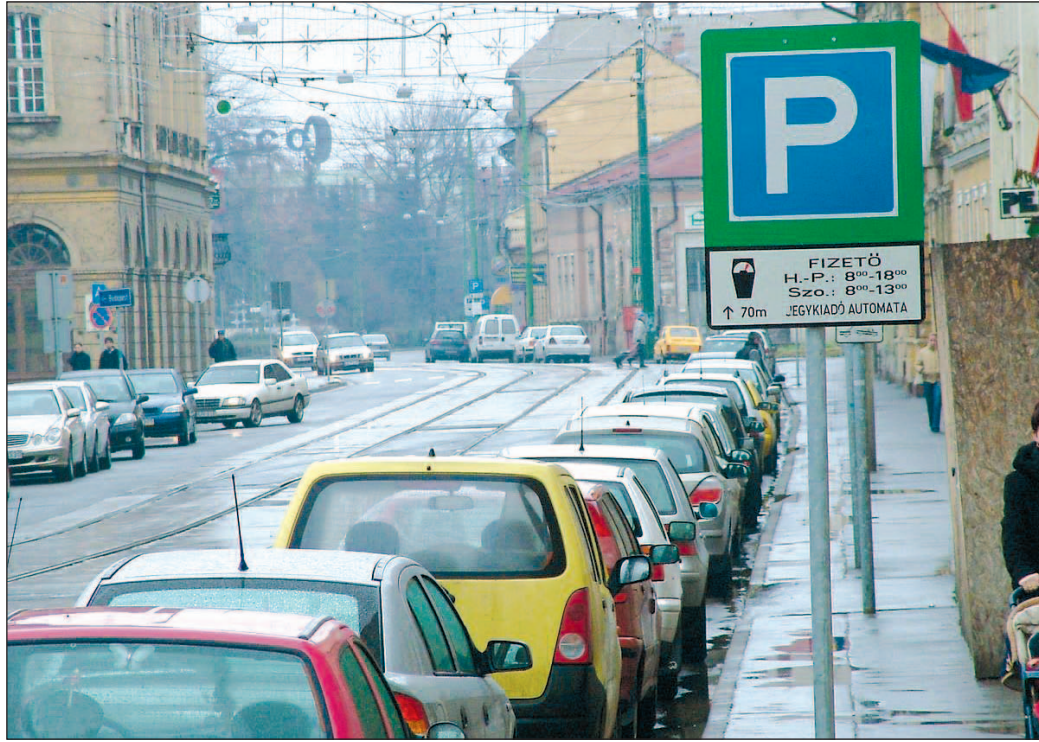
Jövőre ugyanitt ugyanannyiért.