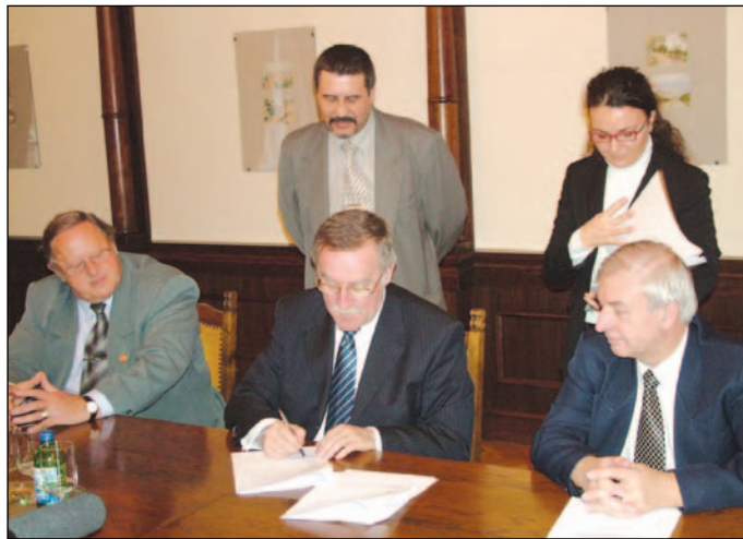
A szerződés aláírása.

A katasztrófa elleni hatékony védekezés és biztonság az utóbbi évtizedben egyre több gondot jelent az Európai Közösség tagállamainak. Az eredményes védekezés, az állampolgárok biztonságának növelése az erőforrások jobb kihasználását, új mód-