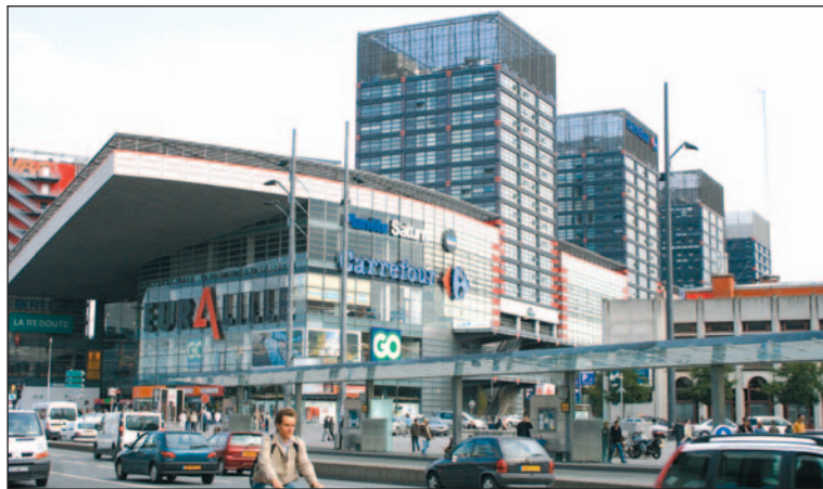
Lille, az iroda- és kereskedelmi központ.