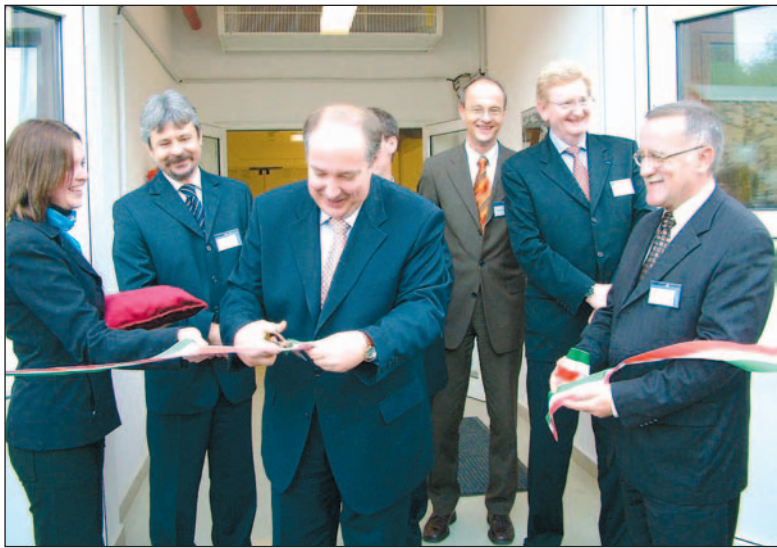
Kiss Péter kancelláriaminiszter vágta át a szalagot.