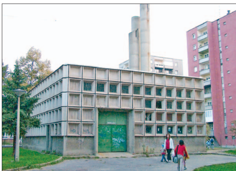
Az önkormányzat és a Mihő támogatja a tervet.

E pénzből meg kell valósulnia – Miskolc kelet-nyugati közlekedési tengelyében – a villamosvasúti közösségi közlekedés teljes rekonstrukciójának, amelynek része a vasúti pálya felújítása, a vonal-hosszabbítás Diósgyőr és Felső-Majláth között, tizenhét alacsony padlós új jármű beszerzése, a ja-