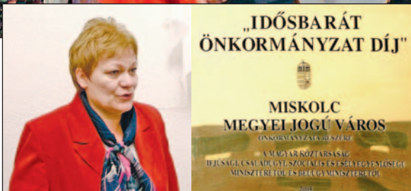
Miskolc a gazdag programok szervezésével, idősbarát munkájával érdemelte ki a díjat.