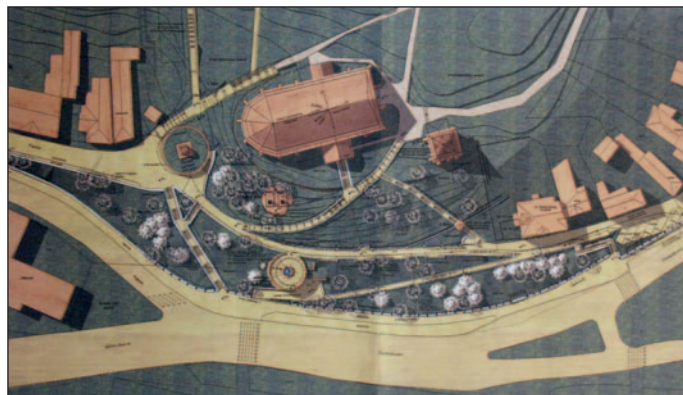
Az Avas északi oldalának rendezési terve, 2004.

A benyújtott terv megfogalmazza a templom és temető kerítéssel történő védelmének szükségességét. (A temető „védtelensége” a 19. század végétől szerepel napirenden.) A temetőbe, ill. azon keresztül hét kapun át lehetne közlekedni. (A pincetulajdonosok átjárható-