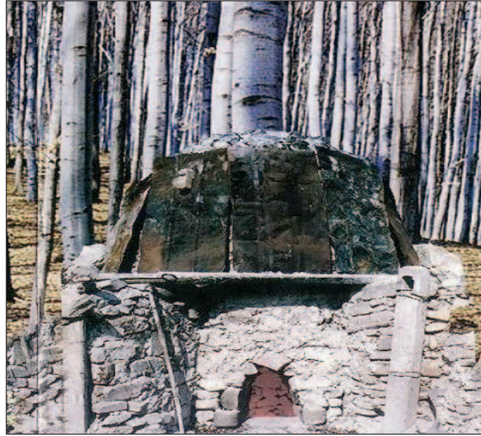
Szénégető bokska a falu határában.