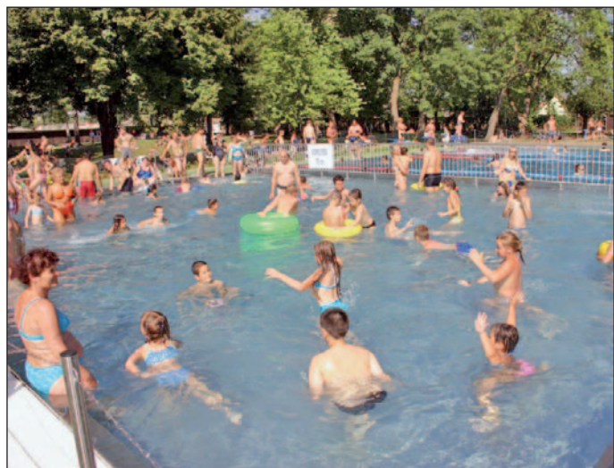
A felújított, s 2005. június végén átadott diósgyőri Várfürdő.

A két nagyműltű ivóvízforrás között volt az 1950-ben lebontott fürdőház, és egy másik épület is, amelyet 1970-ben bontottak le, s a „Királyné fürdőháza” volt a neve. A 23 x 11,5 méter alapterületű épületet közepén folyosó választotta ketté, kettős kijáratlalták el. Egyik részében tükörfürdő volt, a másikban kettős kád-