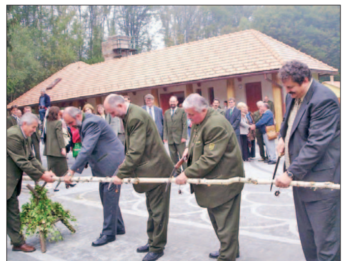
Rendhagyó módon sorompó átfűrészelésével nyitották meg az iskolát.