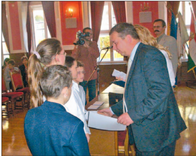
Az AVE Miskolc képviselői adták át a jutalmakat.

A szelektív hulladékgyűjtési akció már több mint hét éves hagyomány, az AVE Miskolc ezzel is elő kívánja segíteni a város tisztaságának megőrzését, a környezeti terhelés csökkentését s a jövő nemzedék környezettudatos magatartását. Mint a díjkiosztón elhangzott, most is elsődleges cél volt felhívni az iskolás gyerekek figyelmét a papír, fólia, üveg, PET-palack, fém italdobozok, valamint a vashulladék rendszeres gyűjtésére. Az együttműködés évről évre hatékonyabb a kft. és az iskolák között, a diákok egyre több szelektív hulladékot gyűjtnek. Míg a 2000/2001-es tanévben 107 111 kg hulladék gyűlt