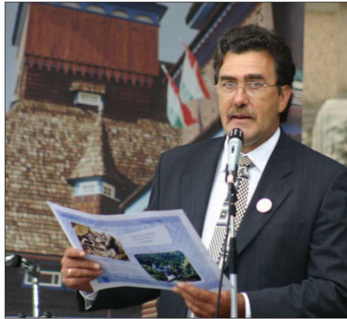
Fedor Vilmos alpolgármester indította útjára a pályázatot.

Egyik sem, inkább kicsit fáradt vagyok. Bevallom, esténként mostanában nehezebben alszom el. De ez az a munkával jár, amit a pályázat kidolgozóival, sok-sok értelmes és ötletgazdag miskolci szakértővel együtt elvégeztünk. Akárhogy nézzük is, Miskolc már pályára került azzal, hogy majd minden értékéről eleddig soha