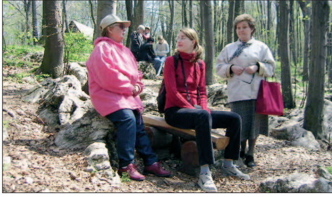
Így ücsörögnek az emberek a bükk-szentkereszt-i csodaerejű köveken, várva a gyógyulást. De már az fél gyógyulás, ha ide kijövünk...

Az 1300 lelkes hegyi falu népe megszokta a nagy forgalmat. Van, aki már térképet is készített, rajzo-